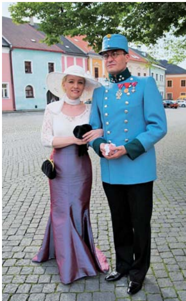
Zahájení výstavy proběhlo v dobových kostýmech.

První část výstavy seznamuje návštěvníky s tím, jak se žilo v Přerově před 1. světovou válkou, která výrazně změnila evropskou