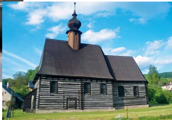
Kostelík sv. Archanděla Michaela v Maršíkově

Byl postaven v pozdněrenesančním rustikálním stylu a spolu s dřevěným kostelem