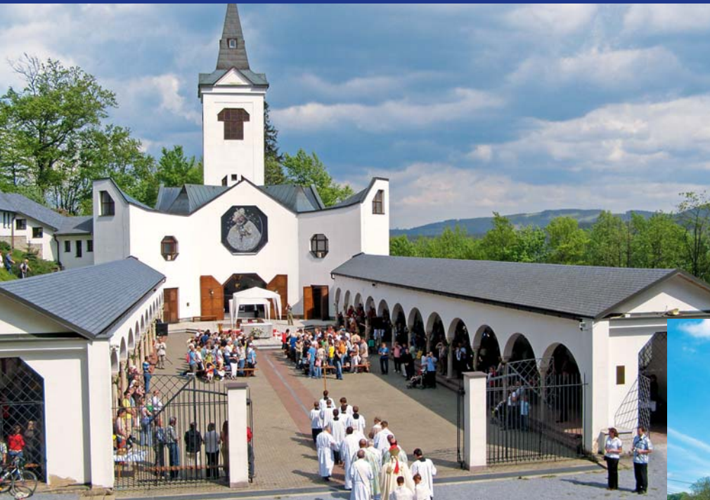
Poutní kostel Panny Marie Pomocné u Zlatých Hor

V minulém vydání jsme v našem magazínu představili církevní památky v Olomouci a blízkém okolí. Dnes přinášíme další přehled lokalit spjatých s vírou a náboženstvím, které v našem regionu stojí za to navštívit.