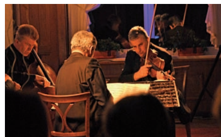
Nebudou chybět komorní koncerty.