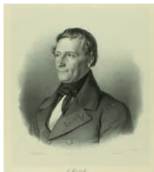
Podobizna Priessnitze

Stalo se již jesenickou tradicí připomenout si každý podzim osobnost zdejšího rodáka, která změnila nejen budoucnost podhorského městečka, ale také vývoj světového lázeňství, Týdnem Vincenze Priessnitze. Letošní celotýdenní slavnosti v Priessnitzových léčebných lázních v Jeseníku přináší opravdu neobvykle nabitý program.