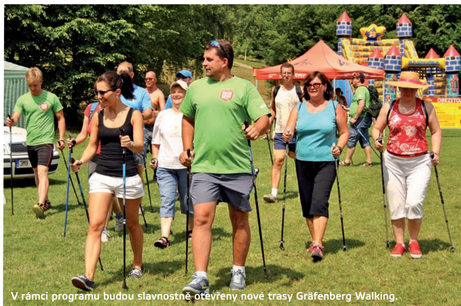
V rámci programu budou slavnostně otevřeny nové trasy Gräfenberg Walking.

Podrobný program a další informace k Týdnu Vincenze Priessnitze najdete na www.priessnitz.cz .