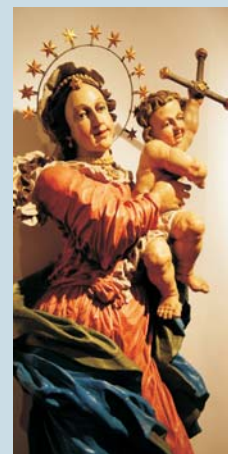
Immaculata, dřevořezba, 2. polovina 18. století

Panna Maria představovala od začátku symbol ženství, mateřství a lásky. Ostatně kult ženy – matky existoval v mnoha kulturách již od pravěku. Marie také představovala v očích prostého lidu ochránkyni, představovala někoho, kdo dokáže obměkčit samotného Boha. Uctívání Panny Marie bylo umocňováno také tím, že byla vždy zobrazována jako krásná a jemná žena.