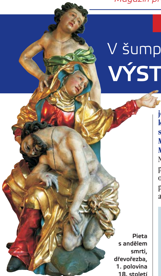
Pieta s andělem smrti, dřevořezba, 1. polovina 18. století

V podzimních a zimních měsících je ve Vlastivědném muzeu v Šumperku k vidění ojedinělá výstava věnující se proměnám zobrazování Panny Marie ve výtvarném umění – Ave Maria, příběh nejslavnější ženy.