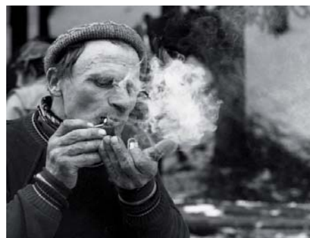
Kocí F.O. Foto Antonín Říha, zvláštní cena

Nakonec doputovala výstava zpět, tam kde vznikla – do Šumperka. Nedaleko odtud žije i autor, pro jehož fotografie byla v rámci soutěže dodatečně