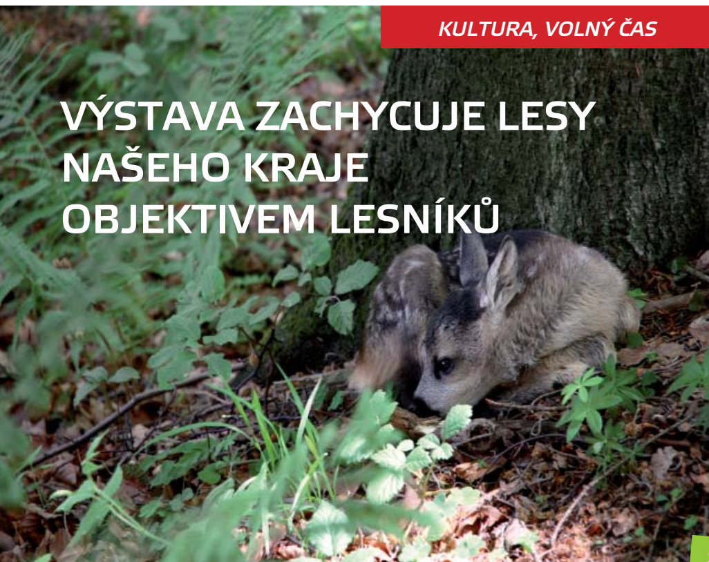
Bezpečí lesa. Foto Jan Kunčar, vítěz kategorie Lesní fauna a flóra

Galerie mladých Vlastivědného muzea Šumperk zahájila 4. prosince výstavu s názvem Lesy KŘ Šumperk objektivem lesníků 2013 .