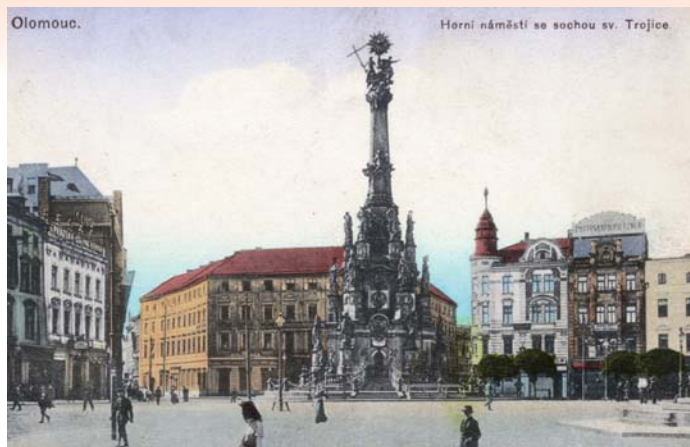
Salmův palác – okrová budova s červenou střechou – se nachází na Horním náměstí.