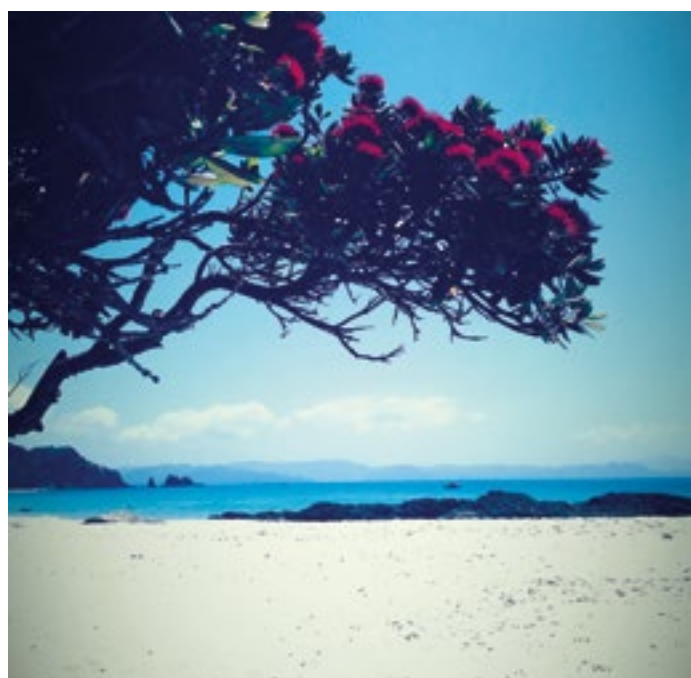
Vánočním stromem na Novém Zélandu je takzvaná Pohutukawa, která je obklopená v tomto období červenými květy. K slavnosti zde patří setkávání se na pláži.