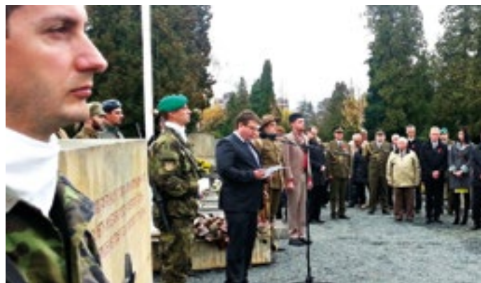
Připomínka Dne válečných veteránů na Ústředním hřbitově v Olomouci.