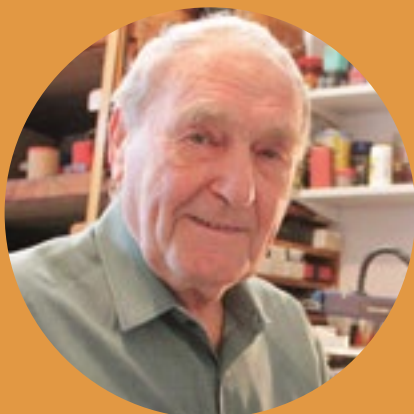
Story: Sběratel betlémů