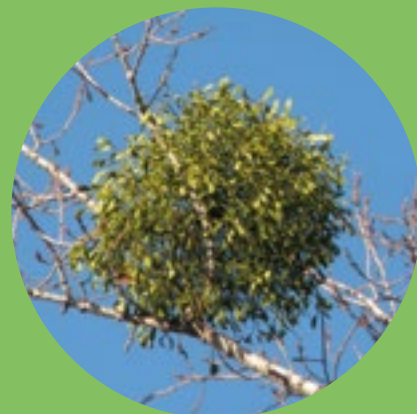
Seriál: Smrk, borovice, jmelí