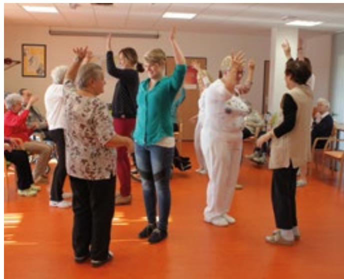
Z hodiny terapeutického tance v Anavitě