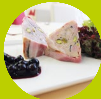
Recepty: Dobroty z Hané a Jeseníků