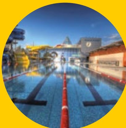
Téma dvojčísla: Velký přehled koupališť