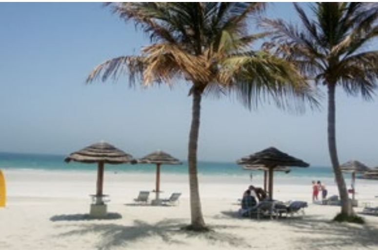
Spojené arabské emiráty: Pláž hotelu Kempinski Ajman.