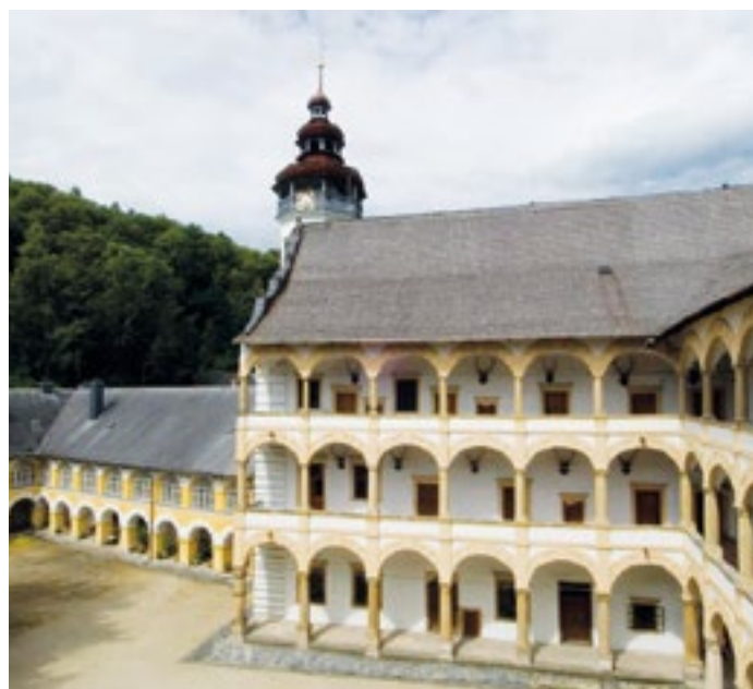
Zámek Velké Losiny, zdroj: archiv zámku

29. 8. Rozloučení s prázdninami a Hradozámecká noc