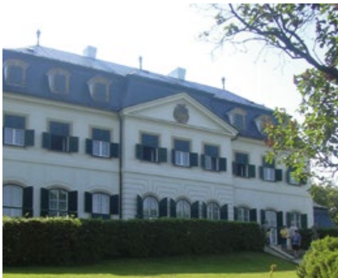
Zámek Náměšť na Hané