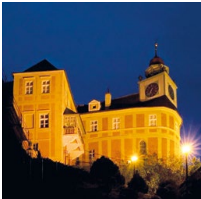
Zámek Jánský Vrch