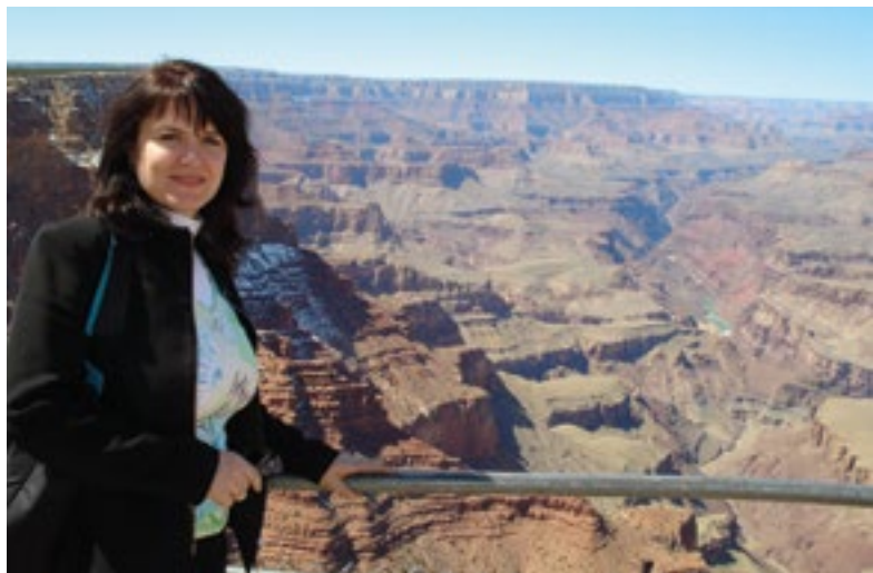
Velký kaňon v severní Arizoně ve Spojených státech amerických je místem, které stojí za to navštívit.

Zajímají mě zejména pokoje. Každá země si určuje počet hvězdiček v podstatě sama. Vy očekáváte pěti hvězdičkový hotel a v reálu dosahuje tak čtyř, protože například je v něm už zastaralý nábytek. Na fotkách se objevují nejčastěji jen hotely samotné a pláže. Už ale nevidíte, že pod okny pokojů je rušná silnice, po které jezdí jedno auto za druhým a spousta motorek. Proto mě vždy zajímá i okolí hotelu. Pak je to pochopitelně přístup a čistota pláže. Vždy je potřeba dívat se na vše v celku. Klienta následně se vším seznamujeme. Například teď jsem se na Bali setkala s tím, že hotel i pokoje byly krásné, ale dole je velice rušná restaurace. I to je důležité klientovi zmínit, že bude v krásném pokoji, překrásné zahradě, ale restaurace nabídne ne moc klidný