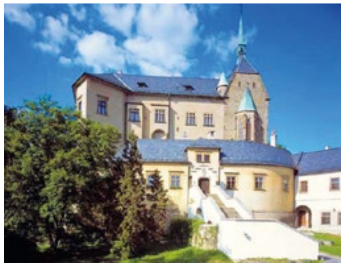
Státní hrad Šternberk, zdroj: archiv hradu

na festivalu vystoupí například David Koller se svým bandem, No Name či Mňága a Žďorp