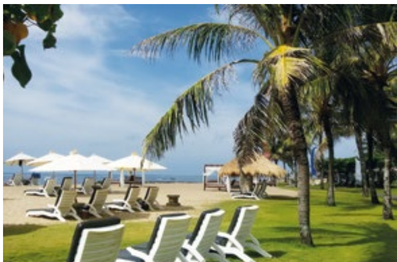
Zájezd do exotických zemí je vhodné objednat už nyní. Na Bali jsou překrásné nejen pláže.

provoz, hodně lidí a fronty. Jsou to detaily, které možná v některých očích nejsou důležité, ale v mých ano, a zákazníkovi dovolenou mohou velmi ovlivnit.