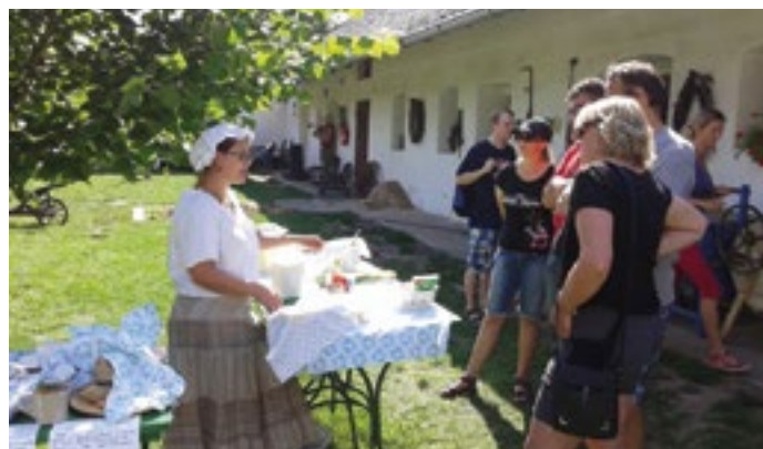
Ilustrační foto. Hanácké skanzen

29. 8. Ukázky tradičního výmlatu ve skanzenu Příkazy