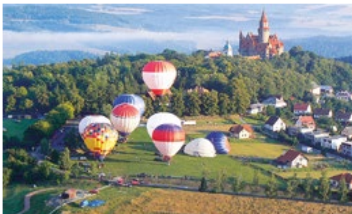
Ilustrační foto. Balony nad Bouzovem, zdroj: www.mechy.cz

romantický večer pod širým nebem při promítání pohádky „O princezně Jasněnce a létajícím ševci“ na I. nádvoří hradu, začátek od 20.30 hodin