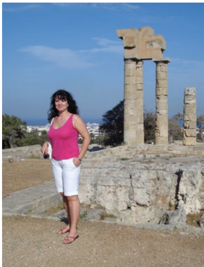
Řecko (na snímku záběr z ostrova Rhodos), Turecko, Španělsko a hlavně Baleárské ostrovy. To jsou hlavní země, které s hrdostí nabízí mimo jiné Bohemian Fantasy.