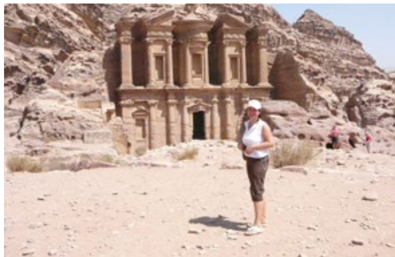
Skalní město Petra v Jordánsku: jeden z novodobých divů světa.

Já létám moc ráda a letadlo je můj nejoblíbenější dopravní prostředek. Nejvíce mě fascinuje, že za pár hodin se člověk objeví na úplně jiném místě, třeba na druhé straně planety.