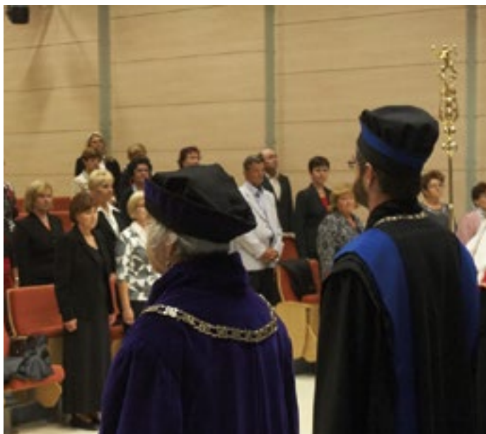
Imatrikulace na Univerzitě třetího věku, foto: Blanka Martinovská

Všichni senioři mohou v Olomouci jezdit neomezeně za tři sta korun za rok, což je výhoda. Je potřeba si však uvědomit, že každou takovou roční jízdenku, kterou mají olomoučtí senioři zdarma, musí město dopravnímu podniku finančně kompenzovat. Nelze tuto výhodu dle mého názoru poskytnout všem.