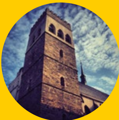
Téma čísla: Dny evropského dědictví