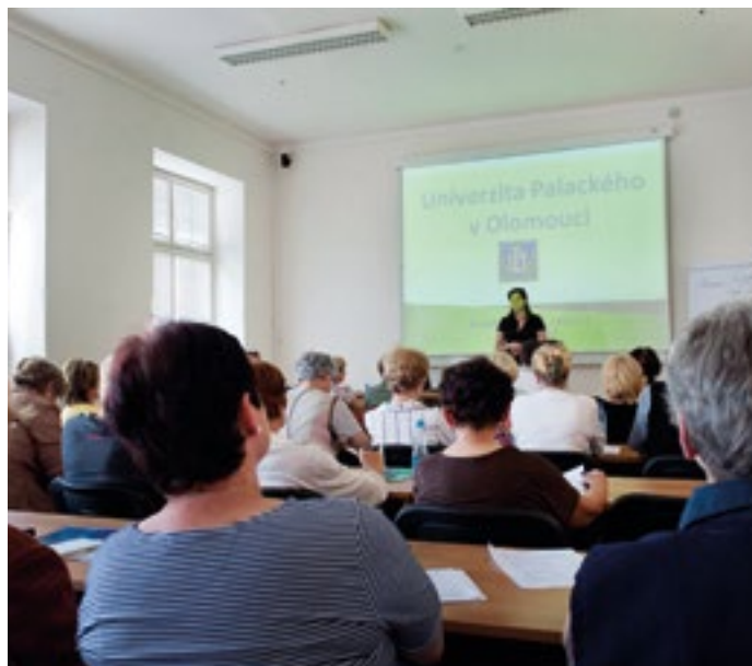
Na jedné z přednášek, foto: archiv U3V