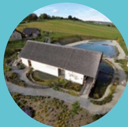
Tip na výlet: Živá voda Modrá