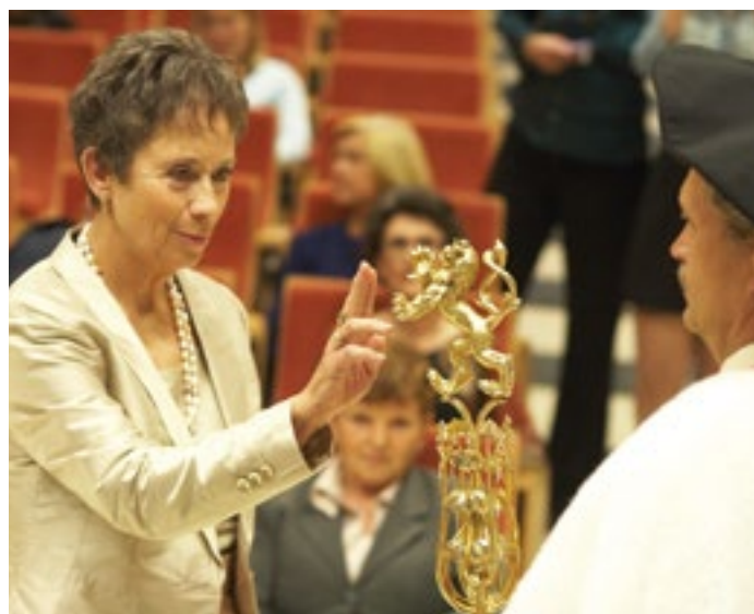
Slavnostní chvíle při imatrikulaci nových studentů na Univerzitě třetího věku v Olomouci