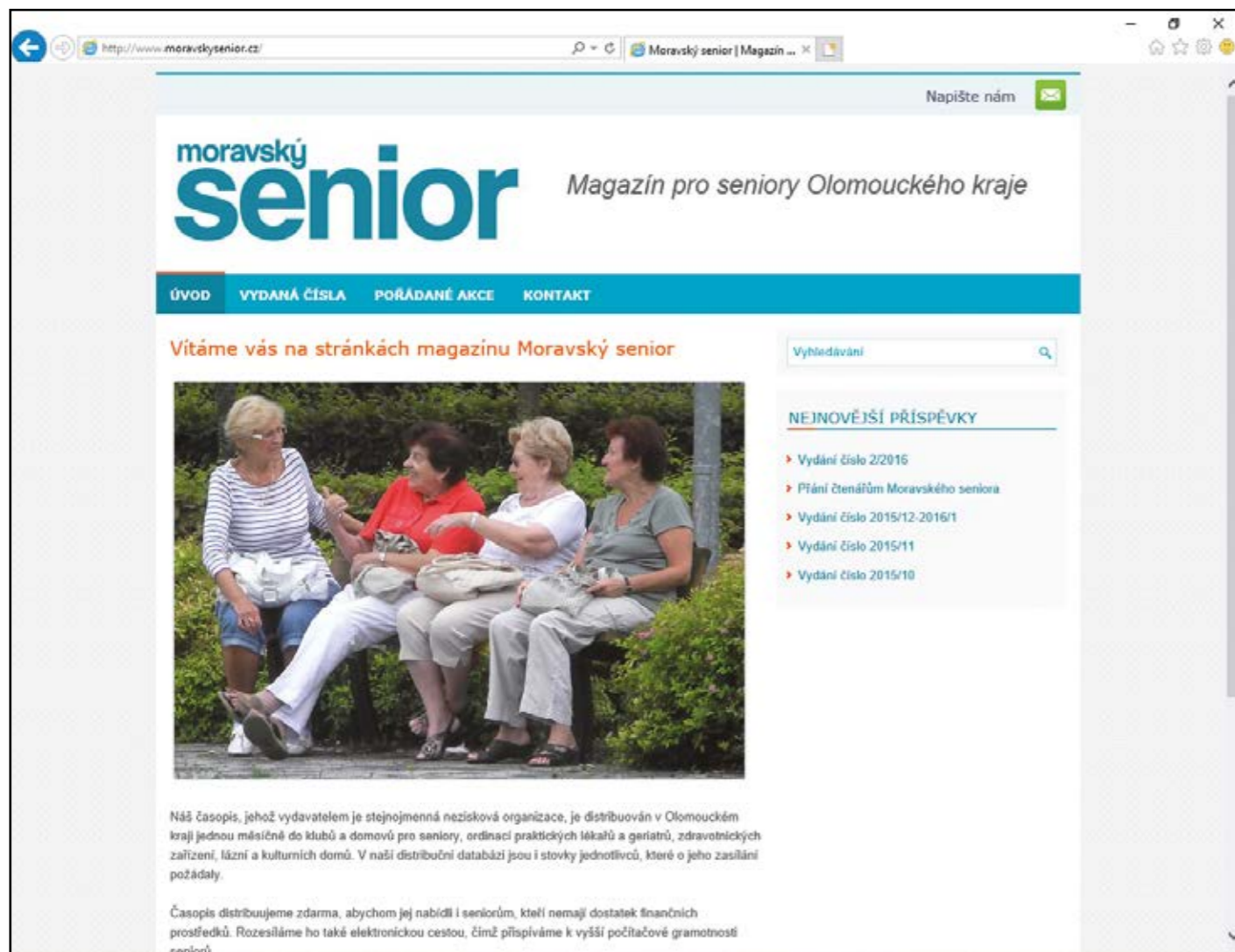
Načtená internetová stránka www.moravskysenior.cz .

chcete zobrazit. Pomocí tlačítek se dostanete například o krok zpět či dopředu, stránku můžete aktualizovat (například sledujete-li takzvané online přenosy zápasů, kde čekáte, až se objeví nové informace), ale také měnit nastavení prohlížeče.