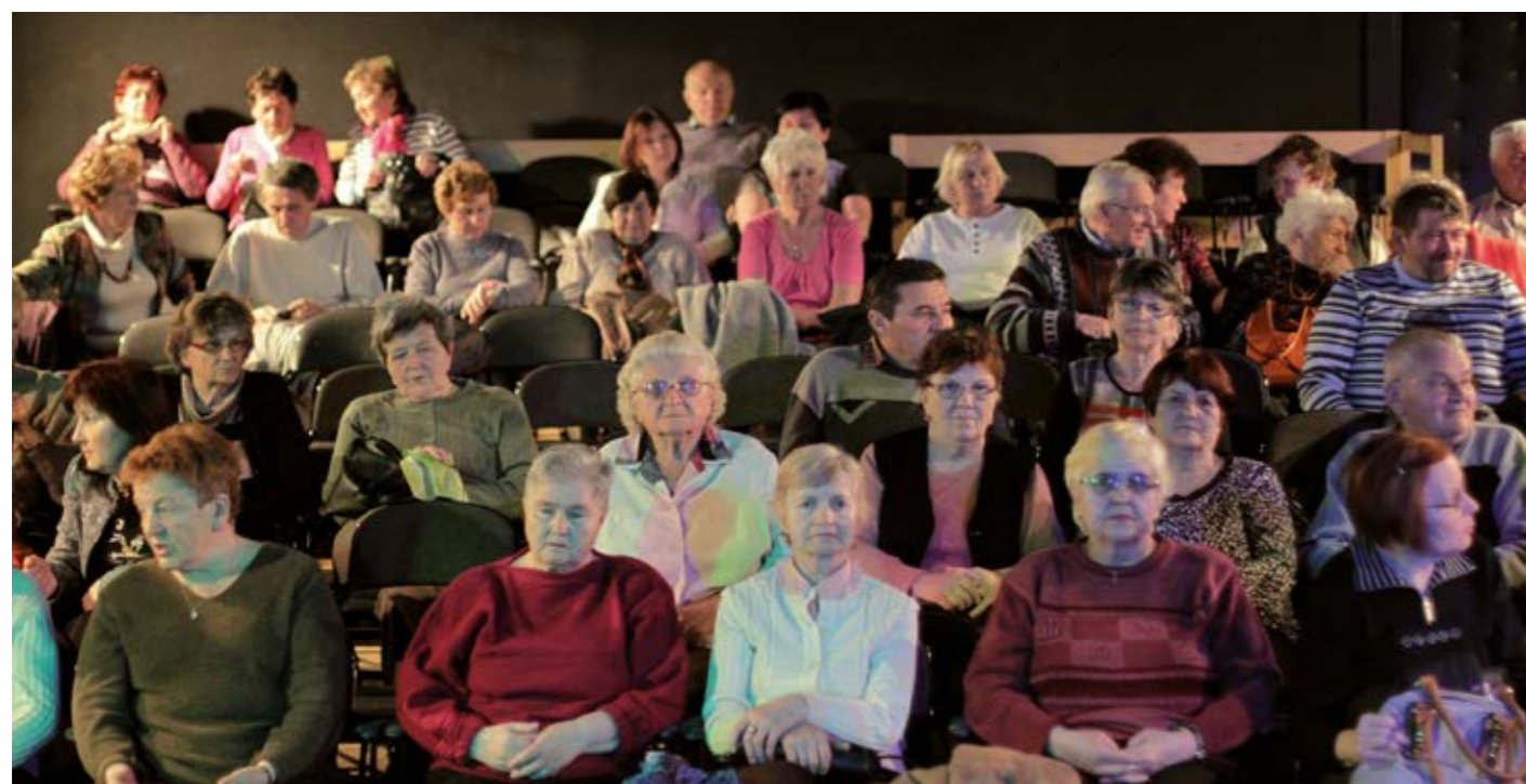
Snímek z loňské projekce pro seniory.