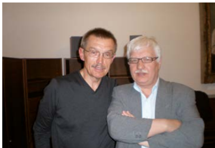
S Emilem Viklickým.