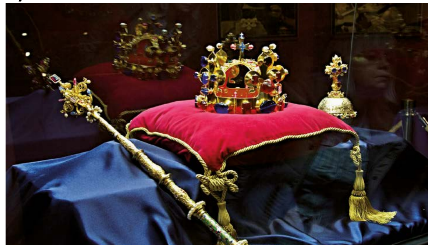
Vlastivědné muzeum v Olomouci uspořádalo výstavu České korunovační klenoty. Ohlédnutí za touto expozicí a snímek zaslal Josef Beran z Olomouce.