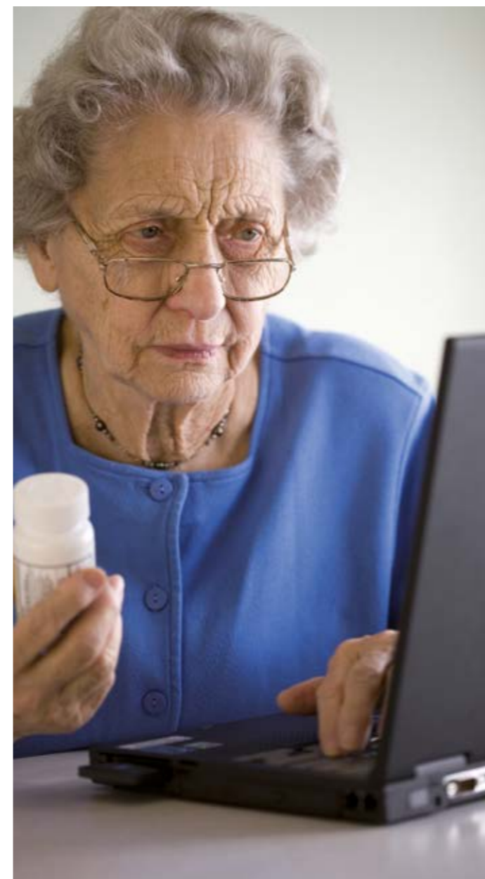
Ilustrační foto. Brouzdání po internetu může být legrace.