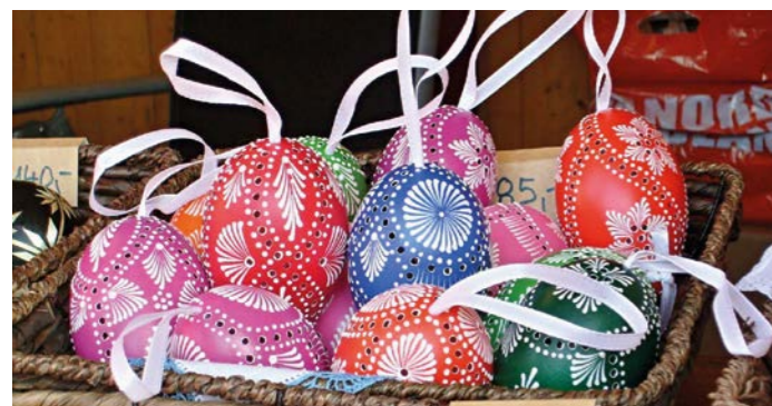
Fotografie z Velikonočního jarmarku v Olomouci zaslal náš věrný příznivec a fotograf Josef Beran z Olomouce.