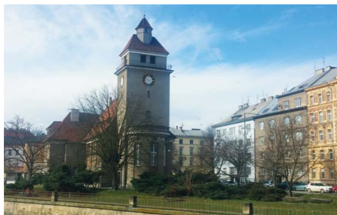
Evangelický kostel v Olomouci. Ilustrační foto.

Také památky mají svůj mezinárodní den. Ten připadá na 18. dubna. V rámci něj nabízí řada měst a kulturních institucí řadu zajímavých akcí. Například v Olomouci se od 15 do 21 hodin mohou lidé přijít podívat do Evangelického kostela, který stojí na nábřeží řeky Moravy, mezi ulicemi Husova a Blahoslavova. Komentované prohlídky nabídnou návštěvu kostela i jeho věže, připraveno bude také nasvícení kostela, koncerty a doprovodný program. V rámci oslav Mezinárodního dne památek a historických sídel budou 18. dubna od 9 do 12 hodin zdarma přístupná všechna zařízení Vlastivědného muzea v Šumperku (Muzeum v Šumperku, Muzeum Zábřeh, Muzeum Mohelnice, Památník Adolfa Kašpara v Lošticích) kromě Lovecko-lesnického muzea v Úsově, kam můžete zavítat od 10.30 do 14 hodin. Bouzovský hrad pak nabídne v tento den zvýhodněné vstupné na jednu z prohlídkových tras od 9 do 15 hodin. Hrad Helfštýn bude mít vstupné zdarma.