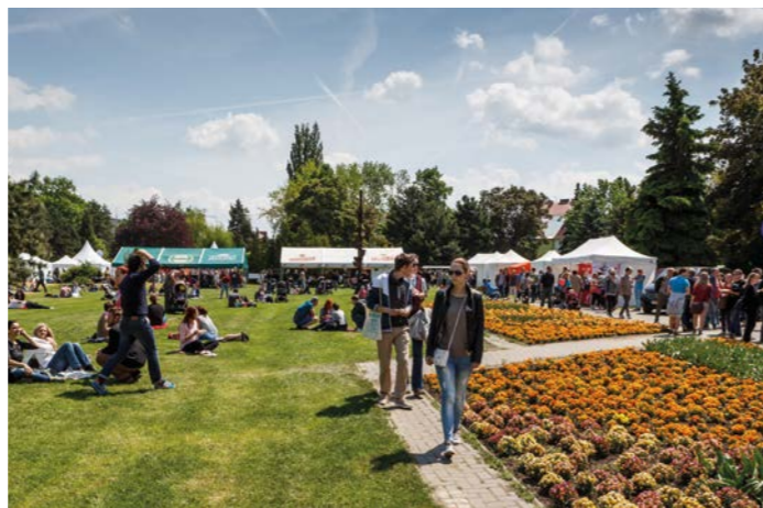
Ilustrační foto z loňského ročníku