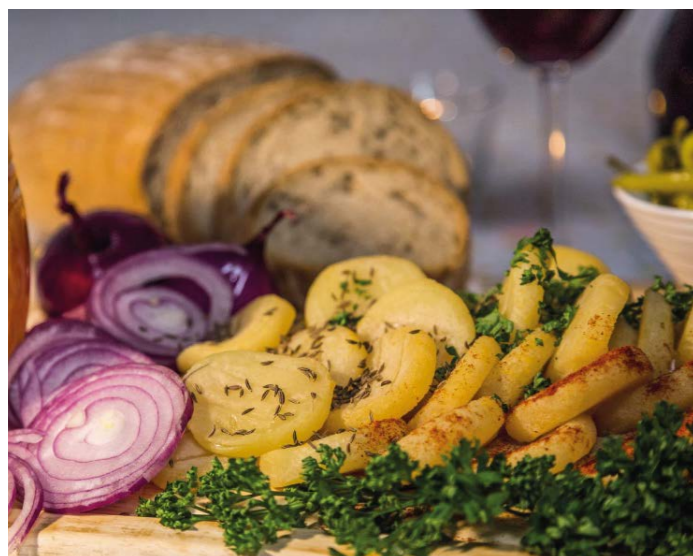
V hlavní roli festivalu budou tvarůžky. Ilustrační foto.

Krajské město bude hostit první ročník Olomouckého tvarůžkového festivalu. Uskuteční se v sobotu 16. dubna na Horním náměstí. Návštěvníky čeká ochutnávka tvarůžkových specialit a regionálních piv. Festival doplní Hanácký farmářský trh a řemeslný jarmark, soutěže pro děti i dospělé a dětské tvůrčí dílny. V rámci doprovodného programu se představí Hanácká mozecka Litovel, taneční skupina Cholinka a kapela Stracené ráj.