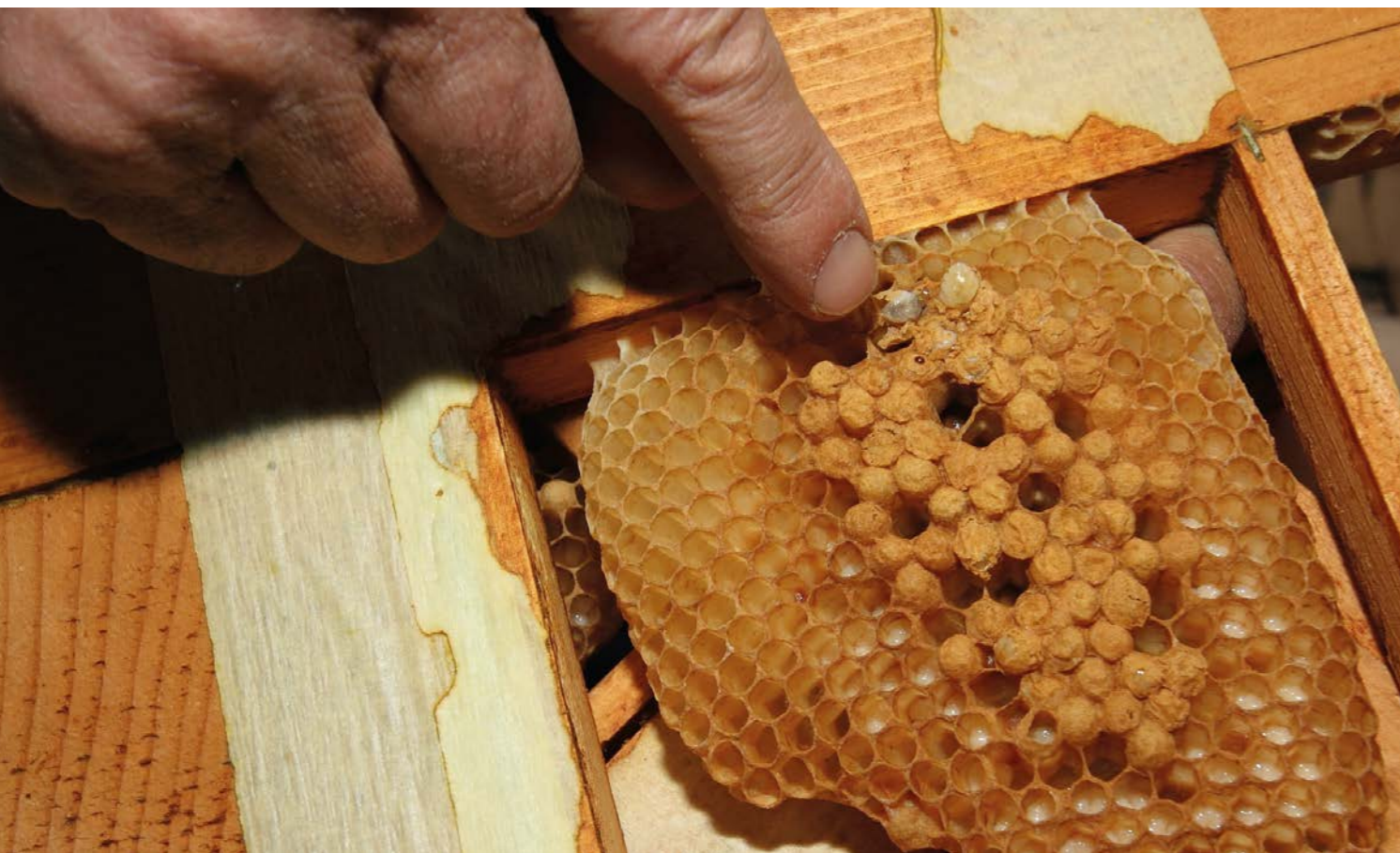
Ilustrační foto. Na plástvi jsou vidět larvy kleštíka včelího.