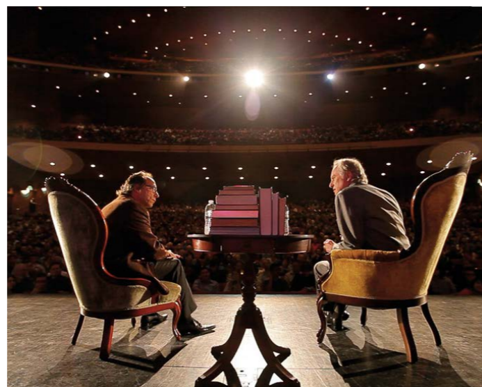
AFO přibližuje vědu širokému publiku. Ilustrační foto.