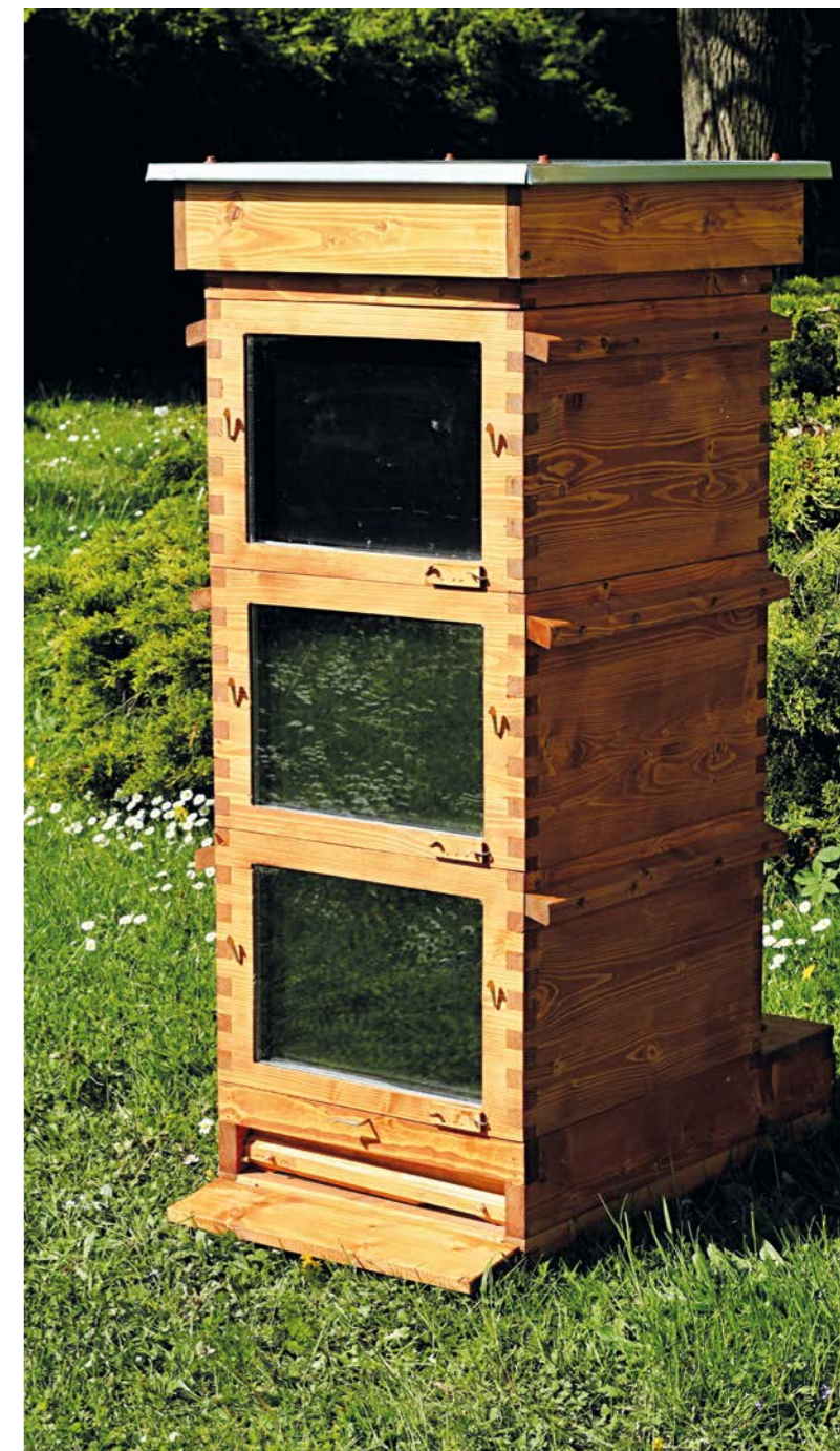
Fotografie termosolárního úlu.