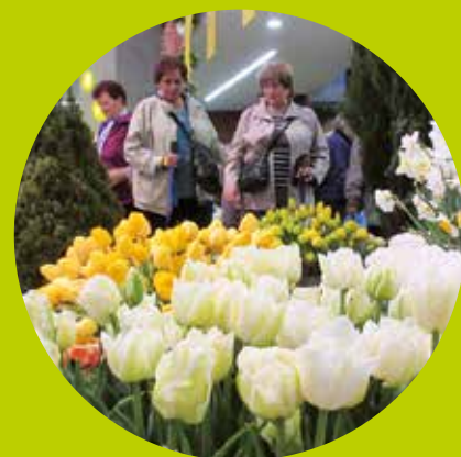
Pozvánka: Letní Flora