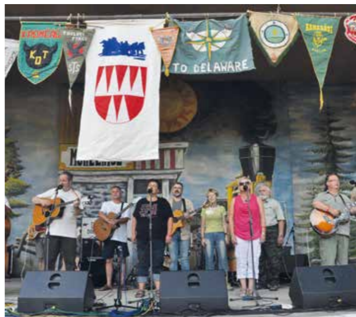
ilustrační fotografie z Mohelnického dostavníku