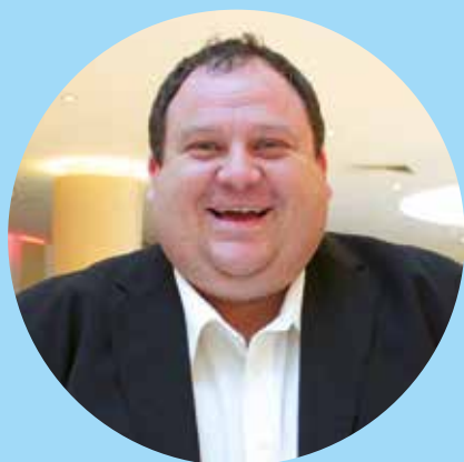
Rozhovor: Viktor Korček o Africe