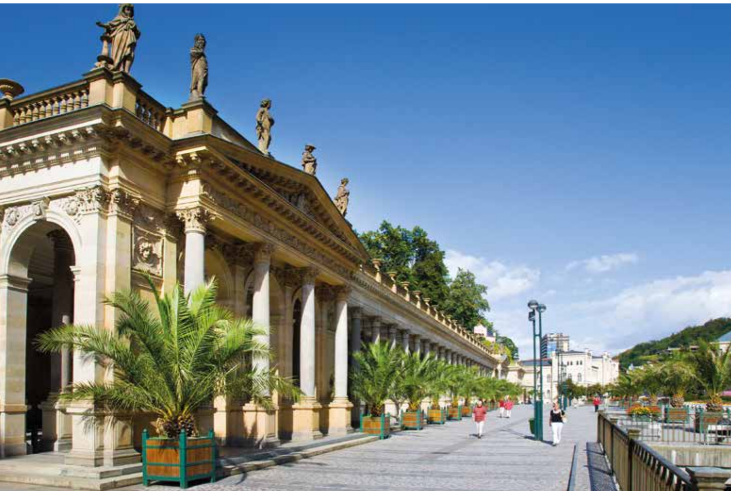
ilustrační fotografie (2x)