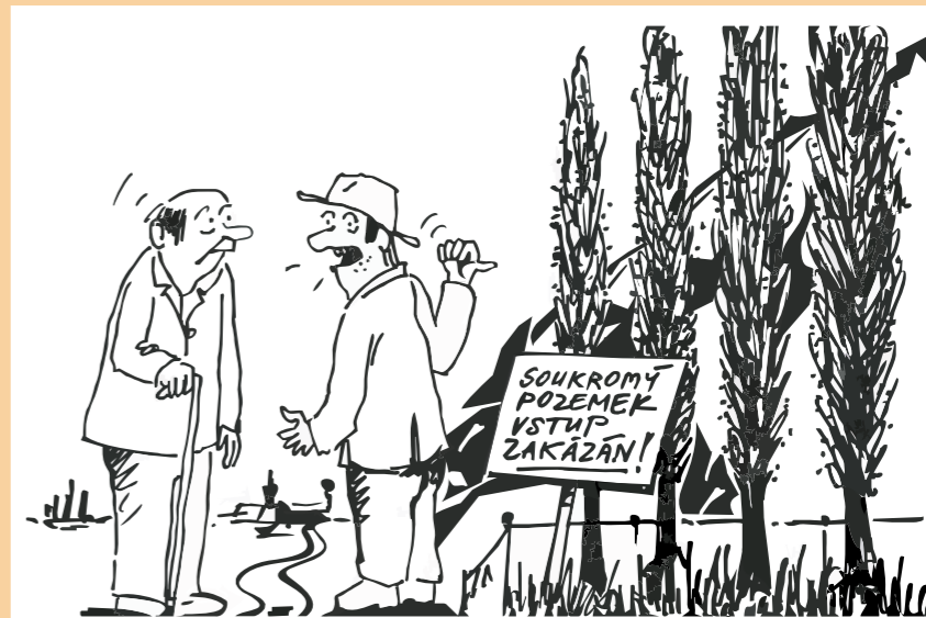
„Pamatuju doby, kdy tady podle skal na topole vodník seděl. Dnes je jiná doba, vodník už je pryč, ochranka ho vyhnala.“

Mezi lidmi Topolu je nápadně vysoké procento spisovatelů a lékařů.