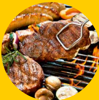
Recepty a rady: Grilování