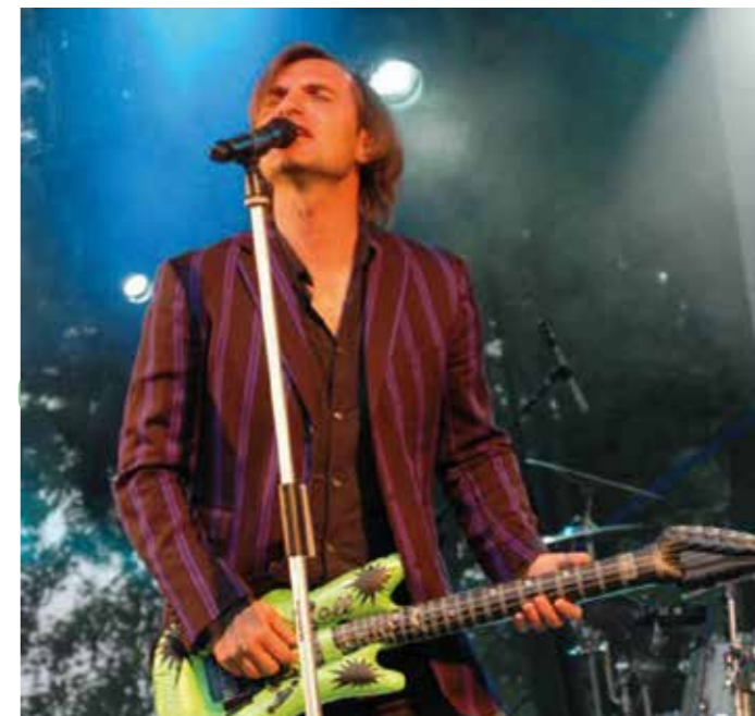
ilustrační fotografie / MIG 21

V pořadí již třináctý ročník nabídne špičku české a slovenské hudební scény, letos poprvé se jmenovaná akce uskuteční ve dvou dnech, a to 29. a 30. července. Páteční hvězdou programu bude Majk Spirit, ale těšit se můžete i na ATMO Music nebo Simu. V sobotu už v 15 hodin program zahájí chlapecká, taneční, pěvecká a striptérská skupina z Prahy 5 - Smíchova MIG 21. Na podiu dále vystoupí například Věra Špinarová, Ewa Farna, Olga Lounová či kapela O5 a Radeček. Hvězdou večera pak bude legendární skupina Olympic. Vstupenka na den stojí v předprodeji 390 korun, na místě pak 490 korun. Festival Šternberský kopec bude hostit areál státního hradu Šternberk. Více informací na www.sternbersky-kopec.cz.