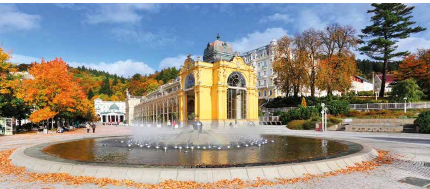
ilustrační fotografie (2x)