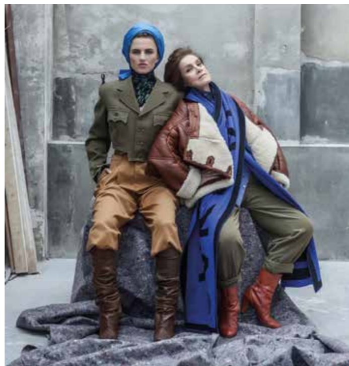
Ilustrační foto k přehlídce OLD'S COOL. Repro z výstavy módních fotografií renomované fotografky Bet Orten. Zdroj: archiv OLD'S COOL

Hlavními tématy letošních výstav, koncertů, diskuzí a workshopů je opět mezigenerační dialog, inspirace nadčasovými myšlenkami a výjimečnými seniorskými osobnostmi. Na druhé říjnové pondělí jsou ve spolupráci s Divadlem na cucky připraveny divadelní workshopy Dramatický kurz SENior a Mezigenerační dílna pro prarodiče, vnuky a vnučky a společně s centrem Sluňákov se chystá přírodovědná přednáška Cesta za tajemstvím lužního lesa s názornými ukázkami a filmem. Kurzy a workshopy mají omezenou kapacitu, proto se, prosím, registrujte prostřednictvím e-mailu na info@elpida.cz. Více podrobnějších informací je k dispozici na webových stránkách www.elpida.cz. (red)