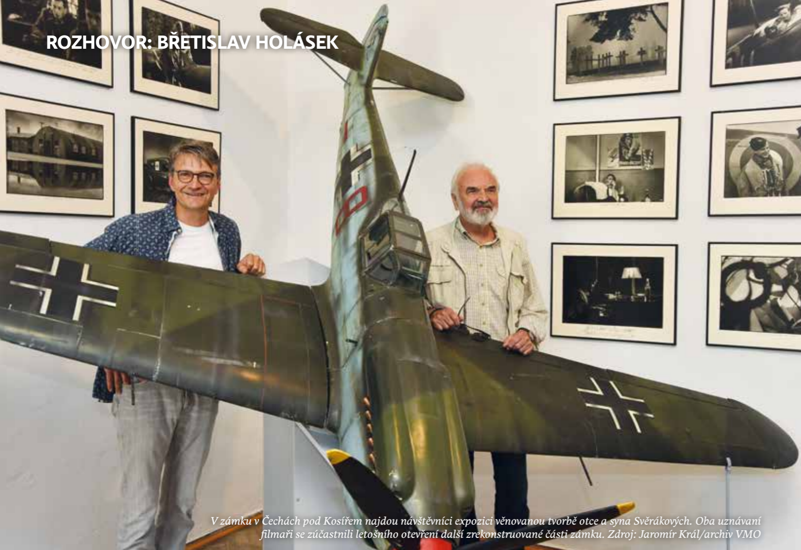
V zámku v Čechách pod Kosířem najdou návštěvníci expozici věnovanou tvorbě otce a syna Svěrákových. Oba uznávaní filmaři se zúčastnili letošního otevření další zrekonstruované části zámku.