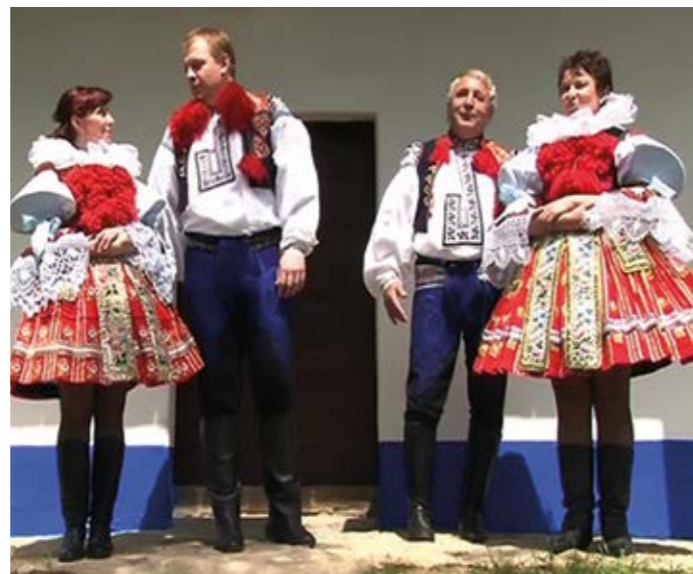
Kapela Vlčnovjanka.