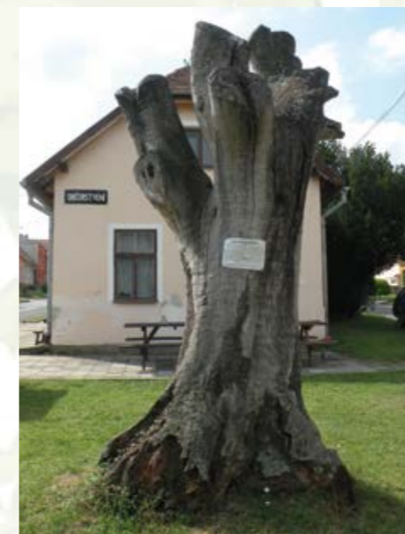
Stará oskeruše poblíž muzea oskeruší v Tvarožné Lhotě.

Značné množství oskerušových stromů roste v Bílých Karpatech - na Strážnicku, a to v okolí jmenované obce Tvarožná Lhota. Ta se dostala do širšího povědomí veřejnosti díky propagaci této zajímavé ovocné dřeviny. Jednou z takových akcí je i Slavnost Oskoruší, jejíž součástí je i košť oskerušových pálenek. V Tvarožné Lhotě se však nachází i zcela unikátní muzeum. Již od roku 1986 pracuje na záchranu oskeruší sdružení INEX SDA Bílé Karpaty. S přispěním řady dobrovolníků a institucí postupně vybudovalo Oskorušovou stezku, Muzeum oskeruší i Arboretum na Salaši Travičná a spolupřádá každoročně akce - Slavnost oskeruší a Oskorušobraní. Oskorušová stezka, o délce 6 kilometrů