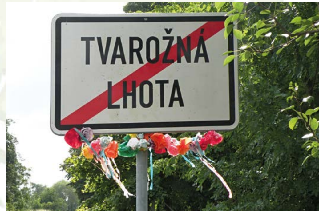
Folklórní výzdoba v obci proslavené oskerušemi.

vede z Tvarožné Lhoty podhůřím Bílých Karpat a zpět do výchozího místa. Na trase stezky máme možnost vidět mohutné chráněné stromy oskeruší, včetně té největší, tzv. Adamcovy oskeruše.