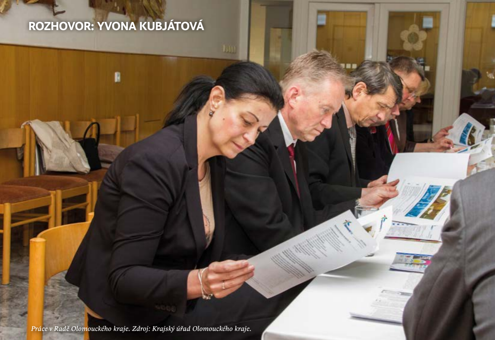
Práce v Radě Olomouckého kraje.

Vraťme se zpátky k sociálním záležitostem. Kraj je také významným poskytovatelem především pobytových sociálních služeb, jako jsou domovy pro seniory, domovy se zvláštním režimem, domovy pro osoby se zdravotním postižením a podobně. Co se v této úrovni změnilo?