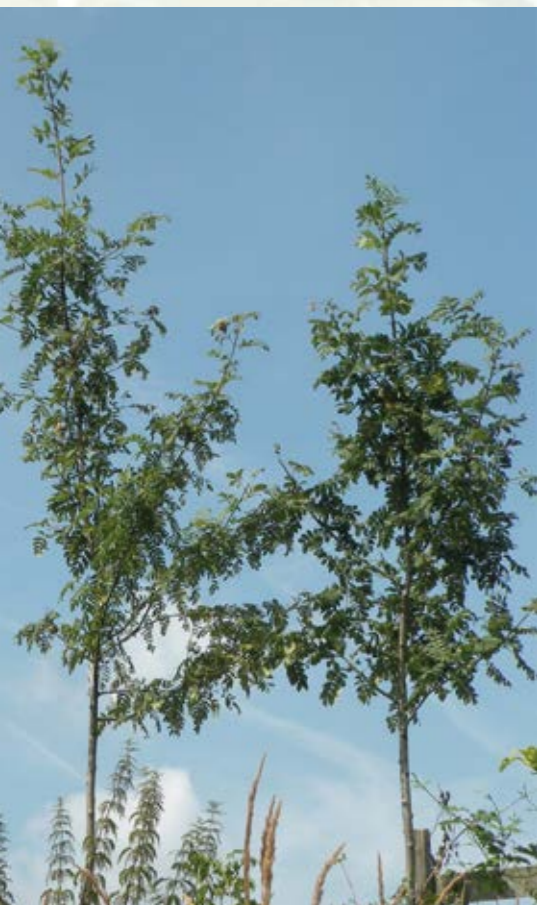
Mladé stromy oskeruše.

Dřevo oskeruše je nejtvrdější z evropských stromů, těžce štípatelné, tuhé a vhodné k obrábění a leštění. Svými vlastnostmi se řadí ke skupině domácích barevných dřev, kam patří jablono, hrušeň, břek a je vhodné i pro nábytkářské využití, k výrobě uměleckých předmětů, silně namáhaných nástrojů, jako např. hoblíků, různých forem a hudebních nástrojů. U nás však dřevo oskeruše nemá v tomto směru větší hospodářský význam.