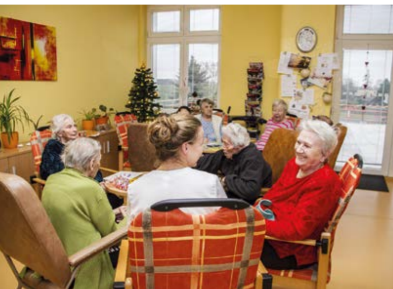
Péče o seniory v novém pavilonu Domova pro seniory Pohoda v olomouckých Chválkovicích.