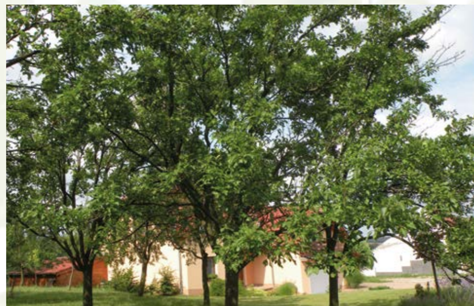
Sad oskeruší na Strážnicku.

Na jaře v roce 2001 byl v rámci projektu záchrany genofondu této dřeviny na jihovýchodní Moravě založen ojedinelý semenný sad. Tato výsadba o výměře 0,87 hektarů se nachází v komplexu listnatých lesů na polesí Diváky lesního závodu Židlochovice. Celkem bylo vysazeno 182 kusů roubovanců. Výsadbový materiál byl získán roubováním či očkováním z reprodukčního materiálu vybraného ze 70 matečných stromů. Ačkoliv má dnes tento sad již 12 let, stromy doposud neplodily. Snad se již v nejbližších letech dočkáme prvních plodů, neboť takto staré stromy by už plodit měly. První přímý písemný záznam o oskeruši, jako ovoci, pochází z antiky od Theoprastose (371 - 287 př.Kr.), a to v jeho díle „Historia plantarum“. V „De Agri Cultura“, autora římského cenzora