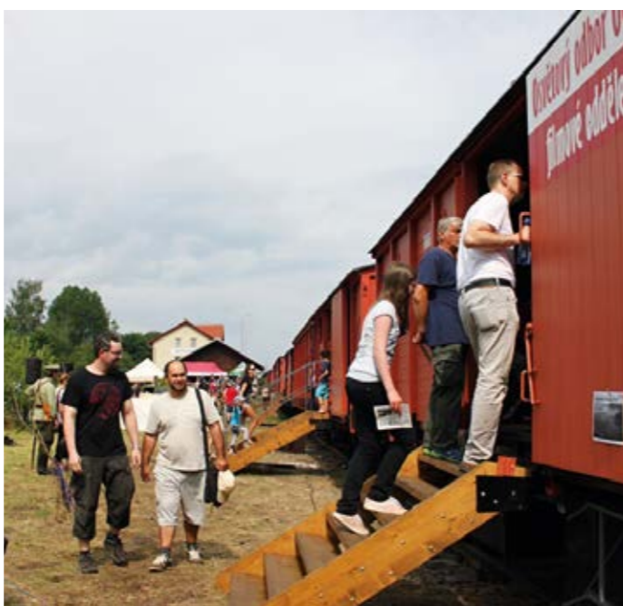
Ilustrační foto z putování Legiovlaku po Česku.

volba OK OBČANÉ PRO OLOMOUCKÝ KRAJ My jsme Vy