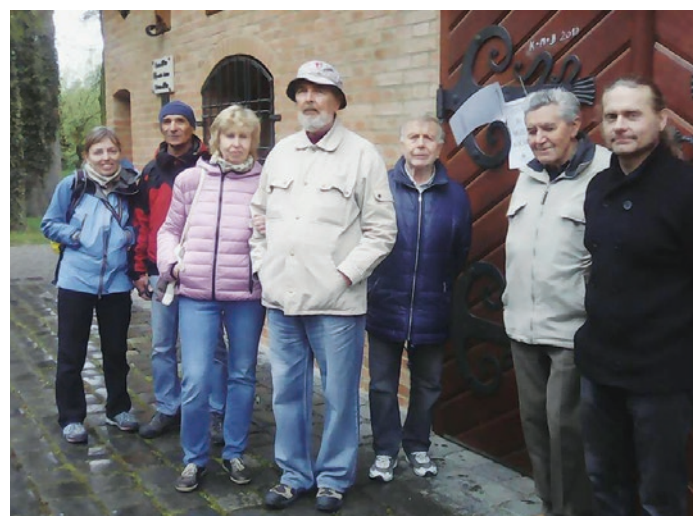
Text a foto zaslal: Jaroslav Fiala

Milé čtenářky a milí čtenáři. Velice si vážíme vaši přízně. Tu dokazuje čím dál tím více vašich reakcí, které nám zasíláte do redakce, ať už poštou nebo elektronicky. Děkujeme a těšíme se na další vaše počiny. Posílejte je buď na adresu Moravský senior, z. s., Táboritů 237/1, 779 00 Olomouc, nebo na e-mail redakce@moravskysenior.cz . Redakce si vyhrazuje právo rozhodnout o zveřejnění a právo na úpravu a krácení textů. (red)