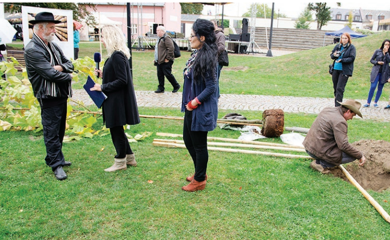
2x ilustrační foto z výsadby parku v roce 2015.