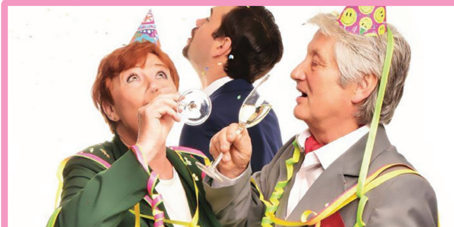
Ilustrační foto k divadelnímu představení Rodinná slavnost.