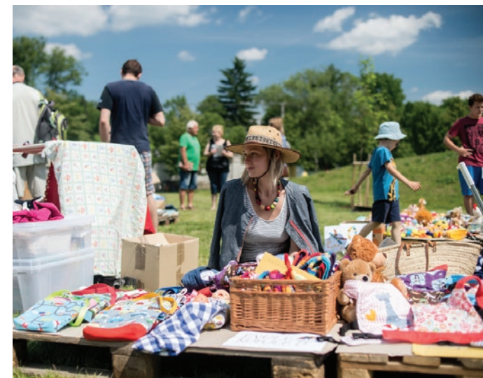
2x ilustrační fotky ze setkání v parku ve Velké Bystřici.

Josef: Důvod je jednoduchý, jeden z cizinců žije právě ve Velké Bystřici a místo nám doporučil. A stačilo se do parku podívat, seznámit se s místními a bylo rozhodnuto. A zdá se mi, že to byla velmi dobrá volba.