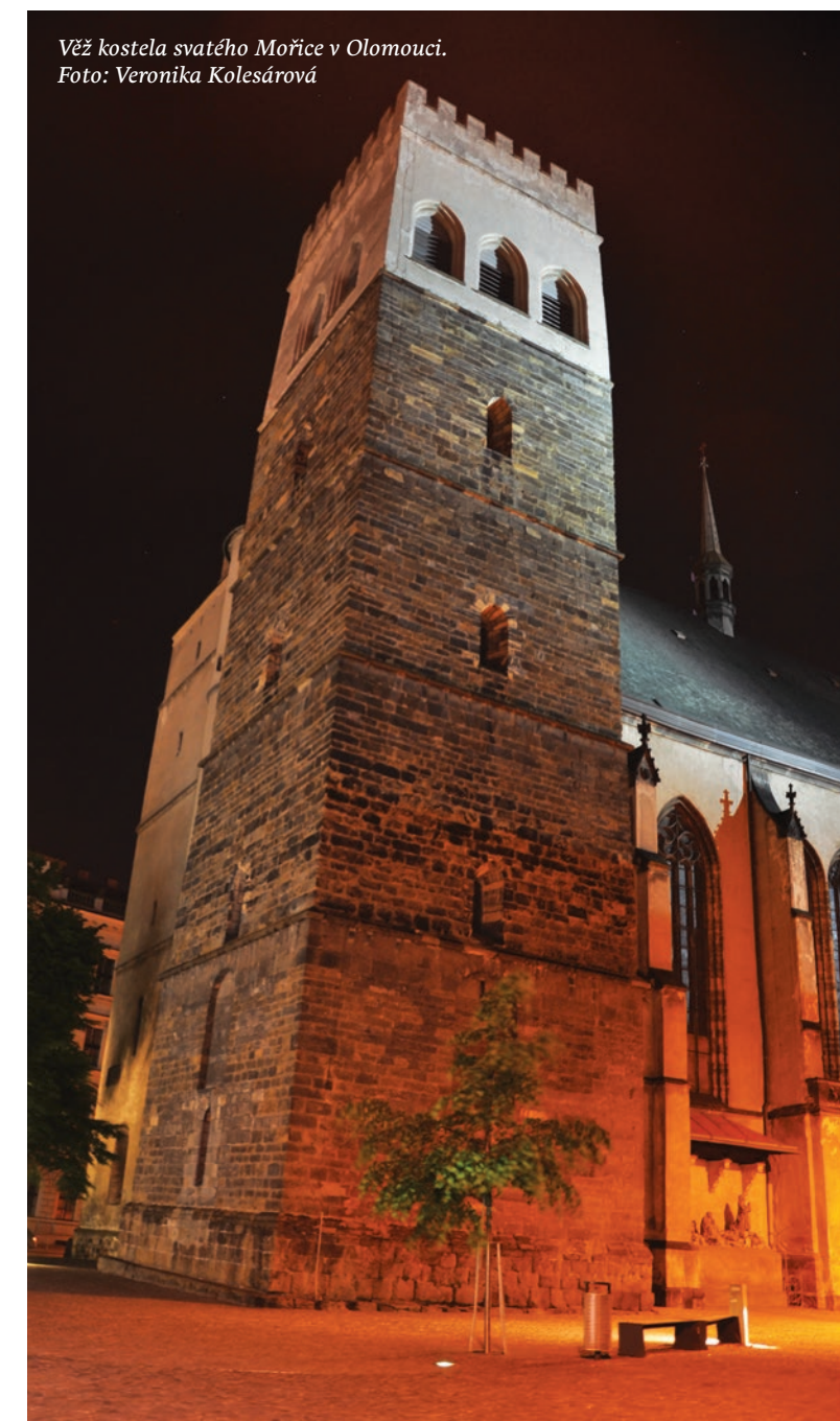
Věž kostela svatého Mořice v Olomouci.