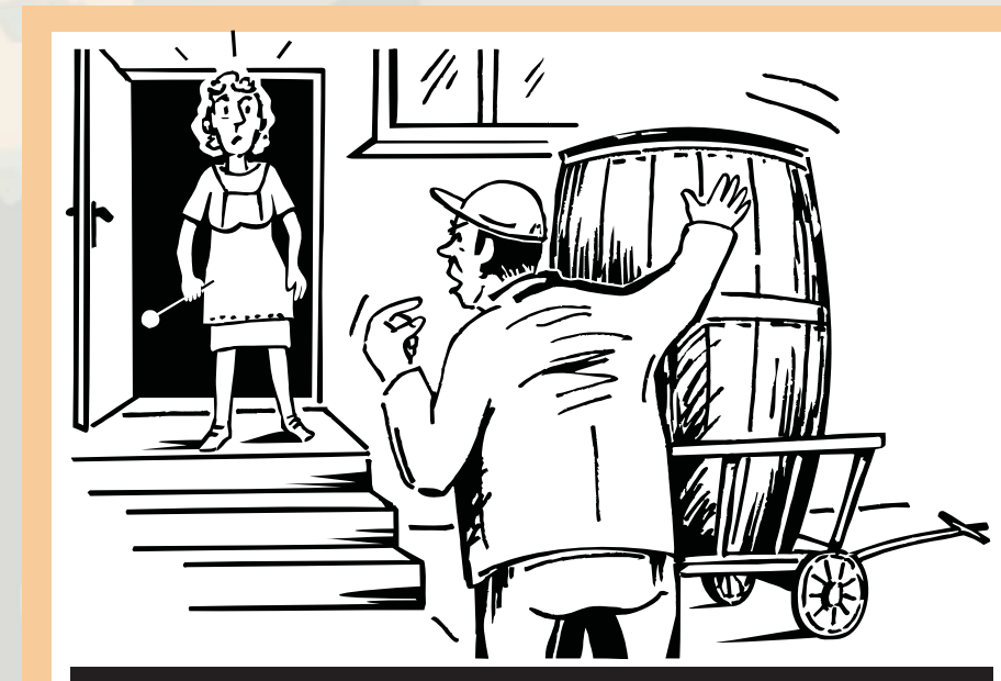
„Měli jsme velikánskou úrodu kdoulí, nechtěla byste, sousedko, pár kýblů marmelády?“