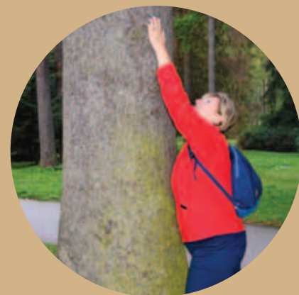
Seriál: Objímání stromů