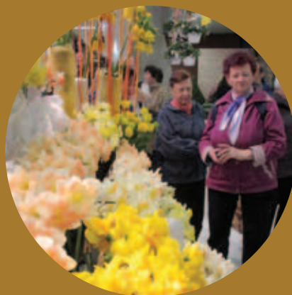
Podzimní Flora a jiné pozvánky