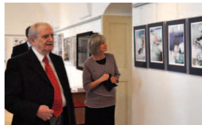
Jiří Suchý a Jitka Molavcová při návštěvě výstavy k Suchého narozeninám.

Expozice mapuje uměleckou tvorbu Jiřího Suchého za posledních šest let. V Handkeho sále Vlastivědného muzea v Olomouci tak jsou k vidění vedle fotografií z archivu Jiřího Suchého více než tři desítky Suchého výtvarných prací, převážně litografií, plakáty z představení divadla Semafor a programy Suchého divadelních her. Na návštěvníky čeká také průřez sbírek Jiřího Suchého, například historických přelb, fotografií, svatých obrázků či gramodesek. „V Suchého tvorbě lze najít touhu, lásku, ale i smutek či utrpení. Vše, co přináší život. Ale všechna díla jsou prostoupena všudypřítomným humorem. Podle učebnic anatomie je člověk obdařen pěti smysly, ale Jiří Suchý po celý život disponuje navíc smyslem pro vtip a smyslem