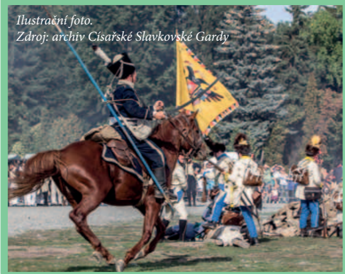
Ilustrační foto. Zdroj: archiv Císařské Slavkovské Gardy

Již po páté se návštěvníci na jeden den vrátí o 200 let v čase, kdy vrcholily napoleonské války v Evropě a olomoucká pevnost plnila funkci významného opěrného bodu rakouské armády. Seznámí se zblízka se životem vojáků na válečném tažení, zhlédnou ukázky výcviku pěchoty, dělostřelectva a jezdeckta, i dobové lékařské péče. Tohoto největšího mezinárodního vojensko-historického festivalu v Olomouckém kraji se účastní na 250 uniformovaných účastníků. Vstup na akci je zdarma.