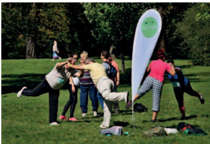
Seniři si 14. září užili ve Smetanových Sadech Sportovní den.

Vyluštěte tajenku a soutěžte o věcné ceny. Znění tajenek pošlete do 16. 10. 2017 na adresu Moravský senior, z. s., Tábortitě 237/1, Olomouc, 779 00, nebo e-mailem na adresu office@moravskysenior.cz. Nezapomeňte uvést celou svoji adresu a telefonní číslo, abychom vás o výhře mohli informovat.