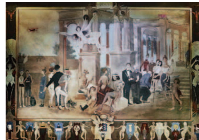
Opona divadla Semafor podle návrhu Jiřího Suchého.