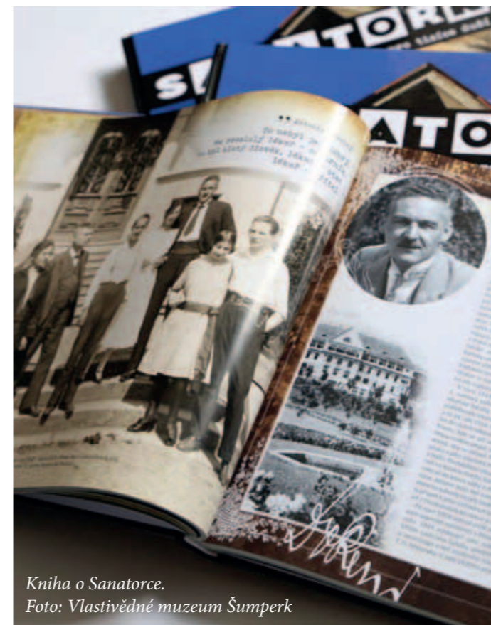
Kniha o Sanatorce.

Slavnostním představením publikace výčet muzejních akcí spjatých se Sanatorkou zcela nekončí. Ti, kteří by si chtěli ještě jednou prohlédnout fotografie vystavené během křtu, budou mít možnost od 18. října do 12. listopadu v Muzeu Zábřeh. (red)