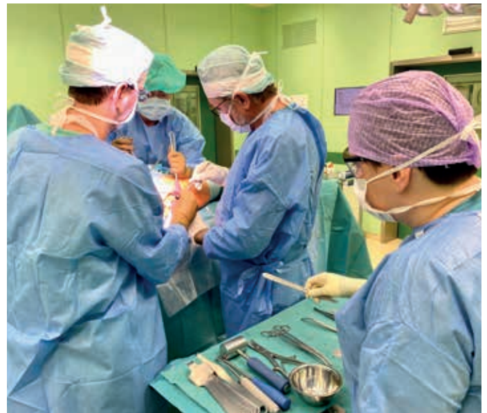
Lékaři Nemocnice Šumperk provedou ročně přes osm tisíc operací, přes tisíc z nich teď musela nemocnice kvůli pandemii koronaviru odložit.