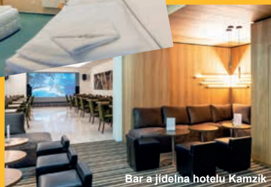
Bar a jídelna hotelu Kamzík