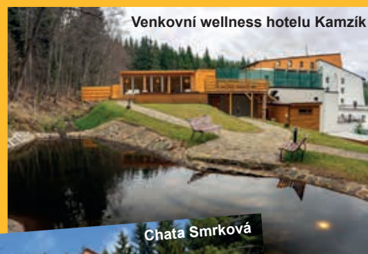
Venkovní wellness hotelu Kamzík

Podmínky zdravotní způsobilosti budou přizpůsobeny aktuální pandemické situaci.