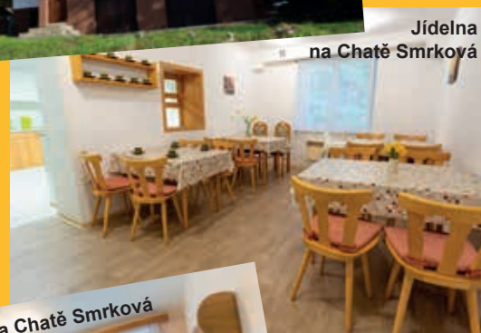
Jídlna na Chatě Smrková