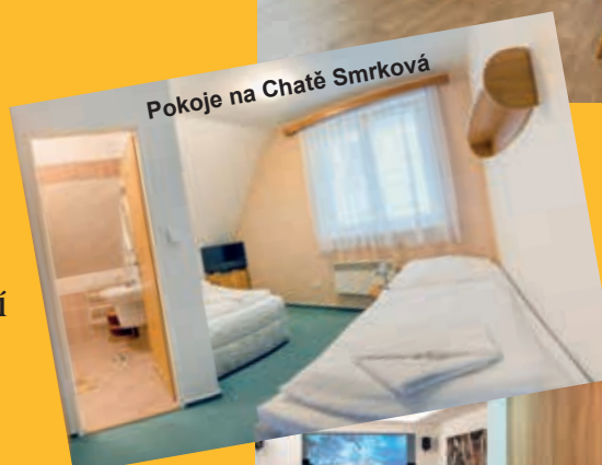
Pokoje na Chatě Smrková