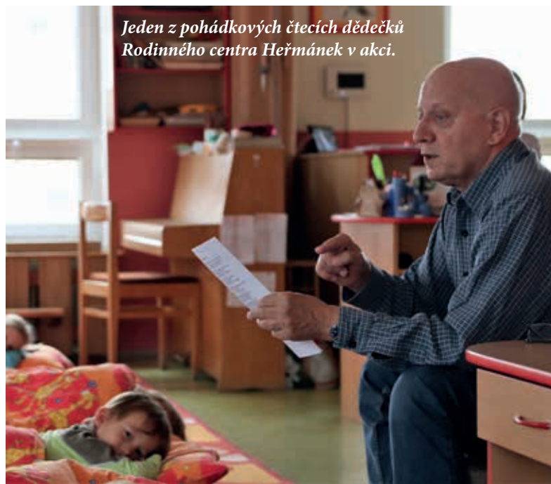
Jeden z pohádkových čtecích dědečků Rodinného centra Heřmánek v akci.

si uvědomit, že nemoc se nevyhlídí, naopak se bude jen postupně prohlubovat a zhoršovat. Pro nás je spolupráce s rodinou klienta zásadní. Snažíme se být osobní a přistupovat ke každému individuálně. Abychom mohli s klientem dobře pracovat, potřebujeme vědět, co měl rád, co dělal, jaké má rád kafe, jaké je jeho oblíbené jídlo... Od něj se to už často nedozvíme, ale když to připomeneme, někdy se dějí zázraky. Přesně proto vznikl před čtyřmi lety náš projekt Zastav a vydechni. Probíhá na našem centru a je určen rodinným pečujícím od uživatelů využívajících naše služby či služby pečovatelské služby. Navzájem sdílí svoje zkušenosti, povypráví si, co prožívají, jak řeší konkrétní problémy s péčí o seniory nejen s demencí, vzájemně se inspirují, radí si.