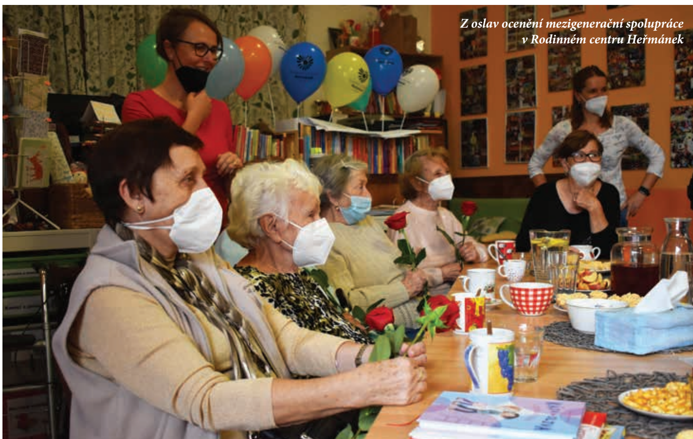
Z oslav ocenění mezigenerační spolupráce v Rodinném centru Heřmáněk

těžké rozklíčovat, jde-li o nástup nějaké nemoci, nebo se to stalo výjimečně.