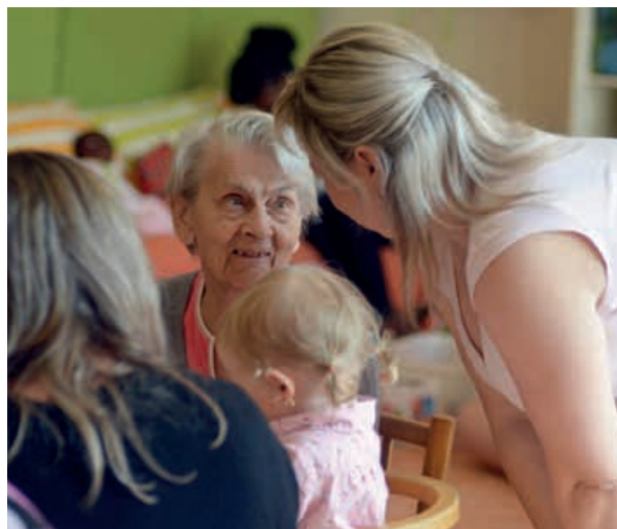
Jedno z mezigeneračních setkání seniorů z Centra denních služeb a dětí v Rodinného centra Heřmánek.