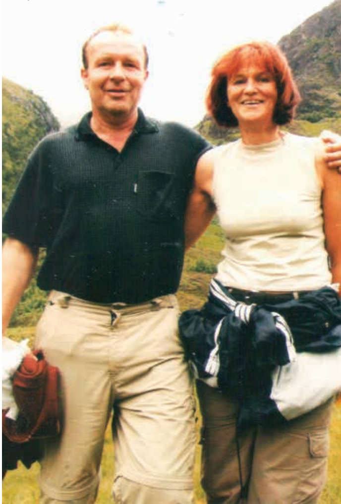
Zájezd do Skotska 2004