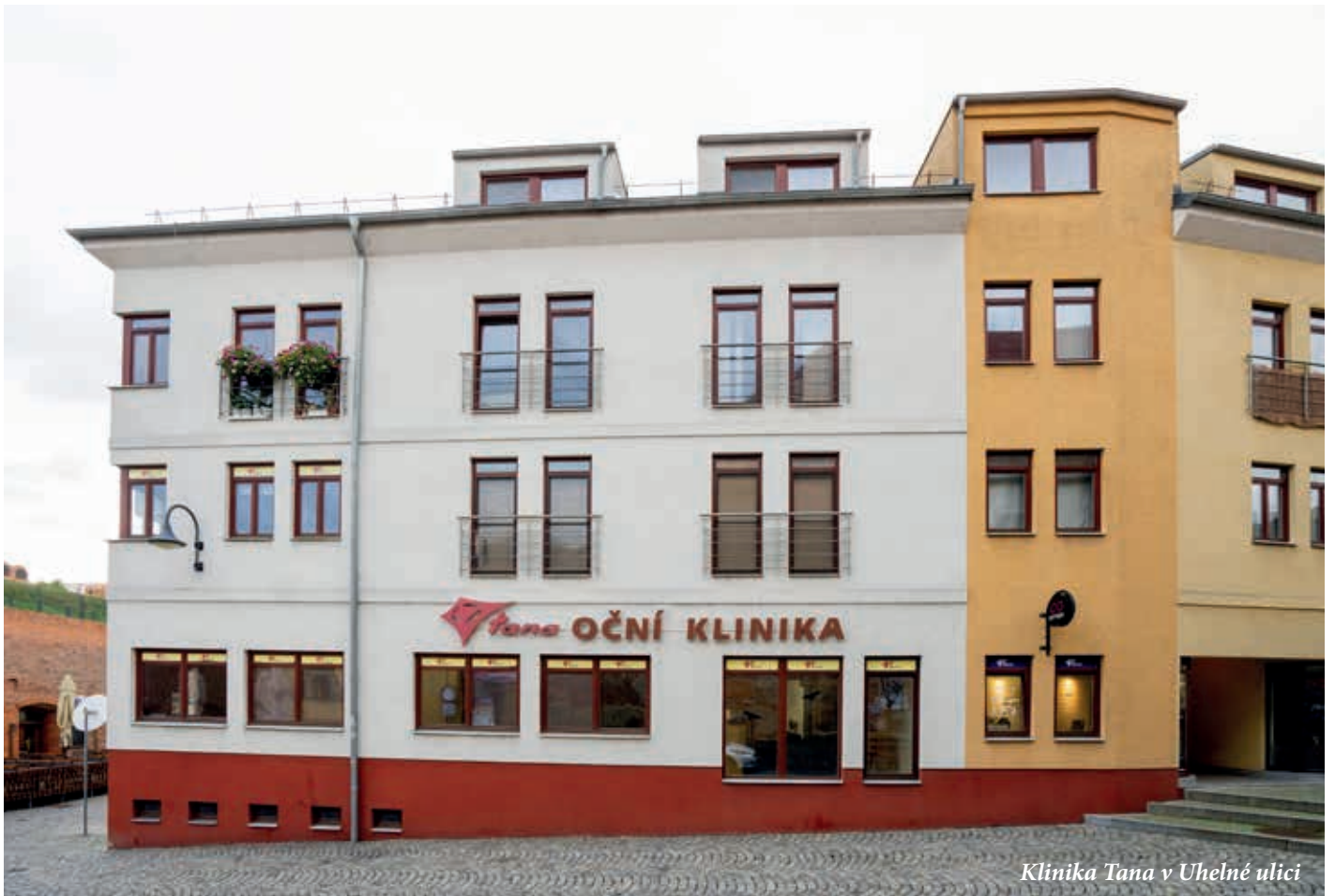
Klinika Tana v Uhelné ulici