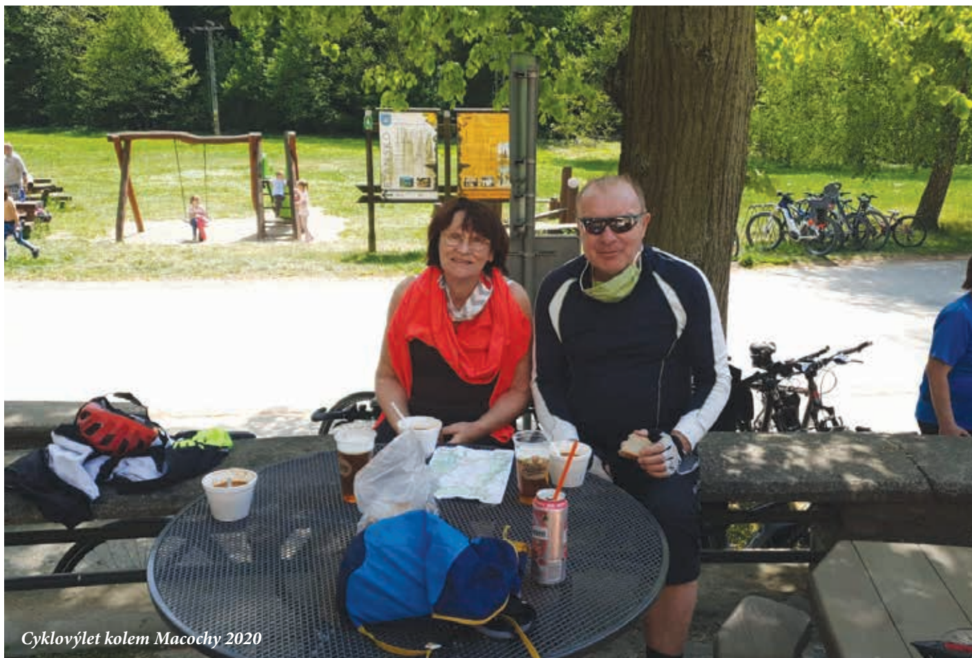
Cyklovýlet kolem Macochy 2020

Šlo o nevinné setkání studentů den před písemnou maturitní zkouškou v restauraci U Medvídka. Prý tam budou k mání témata maturitních písemných zkoušek. Sešlo se tam dost středoškoláků a STB měla žně. Kdo měl u sebe občanku, šel v klidu domů, kdo ne, toho na 24 hodin zavřeli. Tak vznikl seznam osob se zákazem být přijat na jakoukoliv vysokou školu. Iljovi nezbylo, než na studium medicíny v Brně zapomenout a rok pracoval v Technické a zahradní správě města Brna. Ale rok jezdit s multikárou a svážit listí nebo snít z brněnských parků byla pro osmnáctiletého kluka vlastně i trochu zábava. Černá listina nežádoucích osob sice platila i napřesrok,