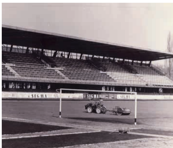
Od dřevěné tribuny po železobetonovou.