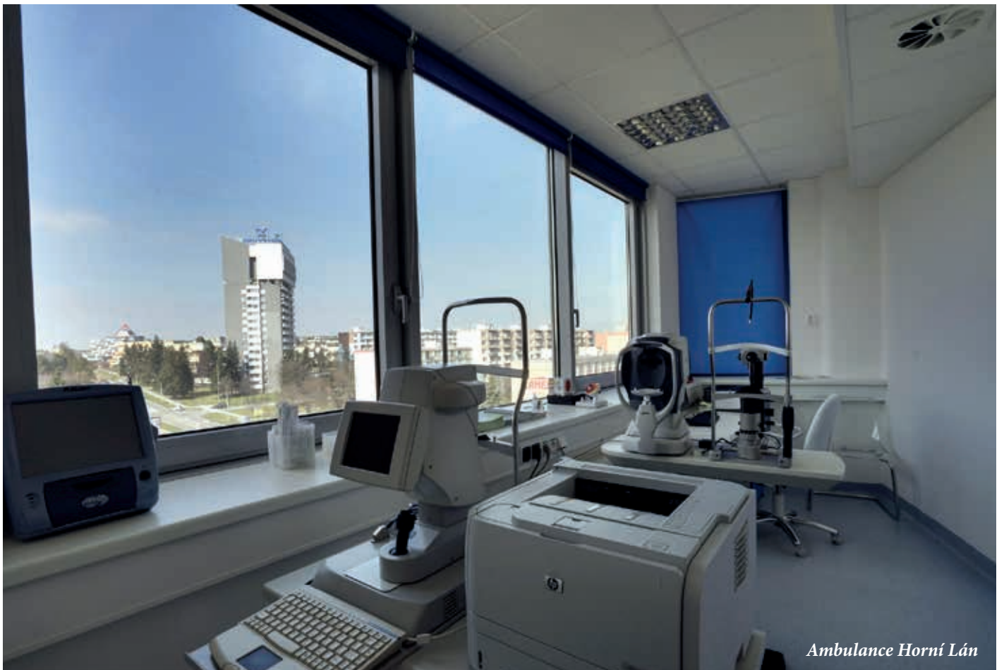
Ambulance Horní Lán