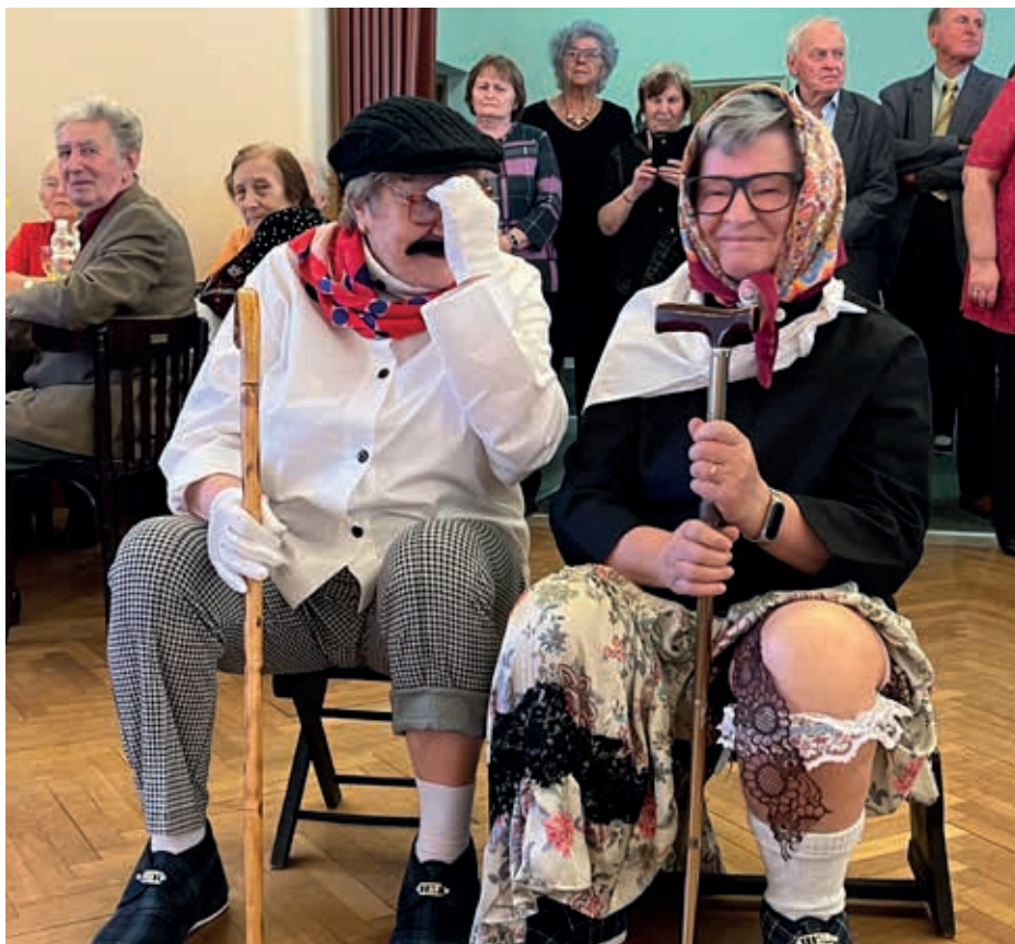
MDŽ ve Skrbeni