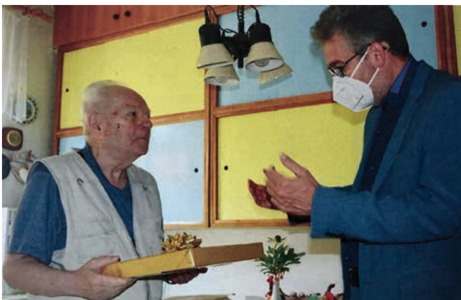
Devadesáté narozeniny pana Otty