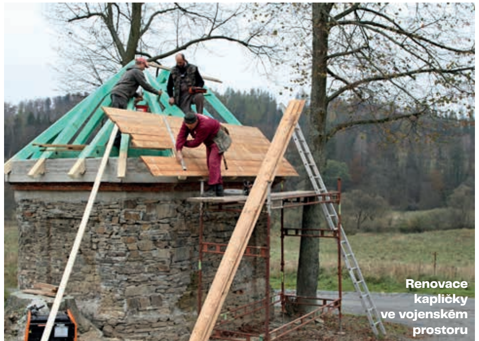
Renovace kapličky ve vojenském prostoru

Začalo to tak, že jsem psal takové krátké příspěvky do Libavského zpravodaje. Pak mě přemluvil Mirek Kobza z Českého rozhlasu, ať to dám nějak dohromady. Na té první knížce jsem nepracoval sám, byla to jen taková brožurka. Ale já jsem s tím nebyl spokojený. Začal jsem sbírat ještě pověsti, místní názvy... Chtěl jsem, ať je to čtivé, o lidech, aby to nebyl jen soupis dat a faktů. Ta fakta tam najdete, ale doufám, že Kronika Libavska je knížka pro všechny. Je to hlavně o příbězích místních lidí. Knížka vyšla už v několika rozšířených vydáních.