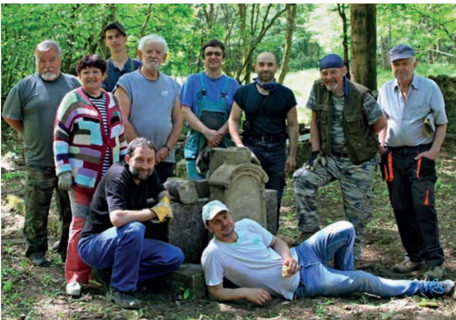
Parta kolem spolku Lubavia

Znal jsem řadu těch lidí. Někteří si třeba pamatovali už jen výhled z okna. Někdy je to opravdu dojemné. Doprovázel jsem třeba starého pána do míst, kde stával jejich dům. Z domu už tam mnoho nezbylo, ale u místa, kde byl kdysi vchod do domu, stála jabloň. On si utrl jablko a rozplakal se, že si po tolika letech utrl jablko z vlastního stromu. To si pak řeknete, že to má smysl, tohle dělat. Někteří návštěvníci jsou tak dojatí... Spousta z těch lidí nám pomohla s mapováním těch obcí. S vysvětlením, co kde bylo... Ale rozhodně se nelze domnívat, že do vojenského prostoru může každý. Rozhodně to není turistické místo. O vstup mohou požádat rodáci, nebo potomci, pokud doloží nějaký doklad o vztahu k místu. Na základě dokumentů požádáme o jednorázový vstup pro takovou osobu, nebo rodinu. Máme to právo, ale hlavně i tu důvěru, že se o takovéto návštěvníky postaráme. Za toho člověka ručíme. A tu důvěru opravdu nechceme zklamat. Děláme to zadarmo. Ale samozřejmě se stává, že nám přispějí na činnost našeho spolku, na obnovu některých dalších památek. Pro běžné turisty slouží akce Bílý kámen, která bývá vždy 1. května. Zisk z této akce se dělí na dva díly. Jednu část dostane soubor Haná a tu druhou Lubavia.