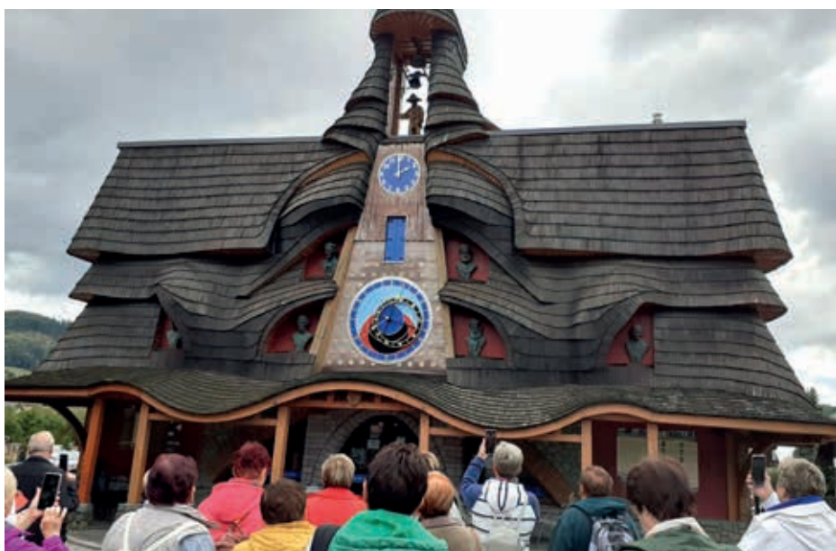
Stará Bystrica – Slovenský orloj z r. 2009