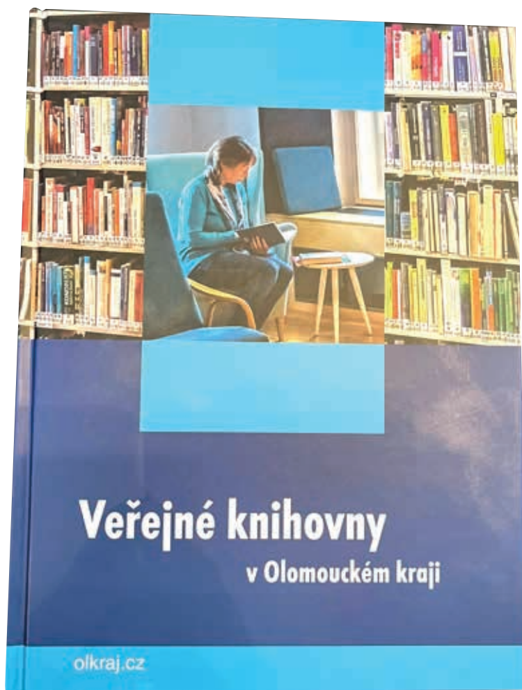
Obálka nové publikace o veřejných knihovnách v Olomouckém kraji.

(NPO) ve výši 16 milionů korun, částkou 5 milionů se na projektu bude podílet také Olomoucký kraj.