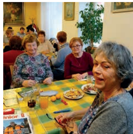
Každý měsíc se scházíme na členských schůzích

Na několik jarních procházek historickými čtvrtěmi Olomouce jsme navázaly pěti až desetikilometrovými výlety do bližšího i vzdálenějšího okolí našeho krajského města. Seznámily jsme se s krásami a zajímavostmi hradu Helfštýn a přírodní rezervací Škrabalka. Cestou z Bludova, kolem kapličky sv. Trojice a přes